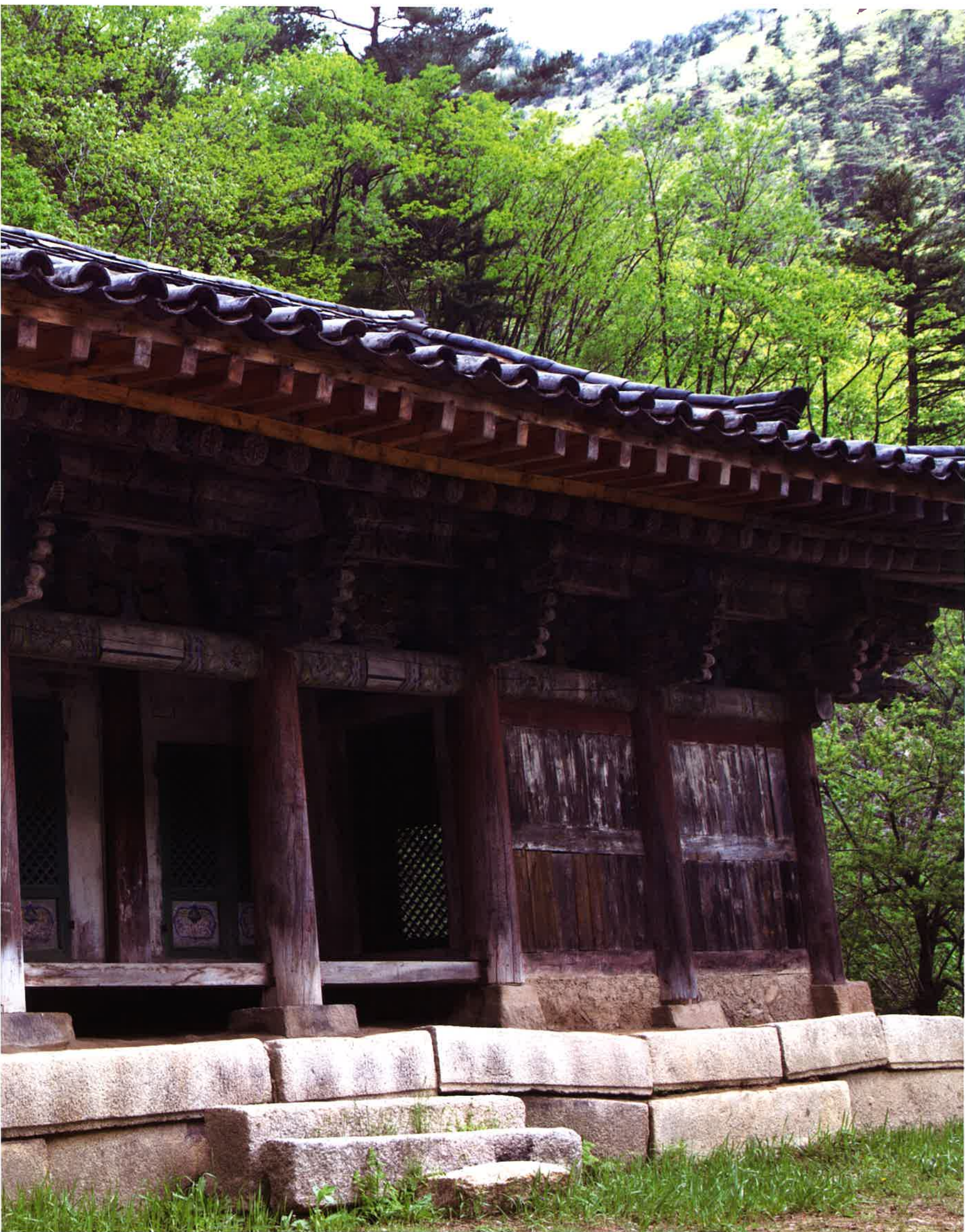
불지암 앞면 / 佛地庵 前面 / front, Puljam

Puljam in Kūmgang mountain was established in King Sejo period in Chosŏn period, and re-constructed in 1619(11th year of Kwanghaegun) after being destroyed. It is located near Myogilsang and it's a gabled house with 6 front aspects and 3 side aspects.