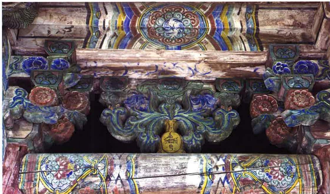
불지암 앞면 화반 2 / 佛地庵 前面 花盤 2 / front Hwaban 2, Puljiam