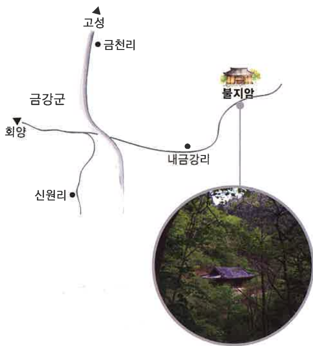
불지암 원경 / 佛地庵 遠景 / distant view, Puljiam