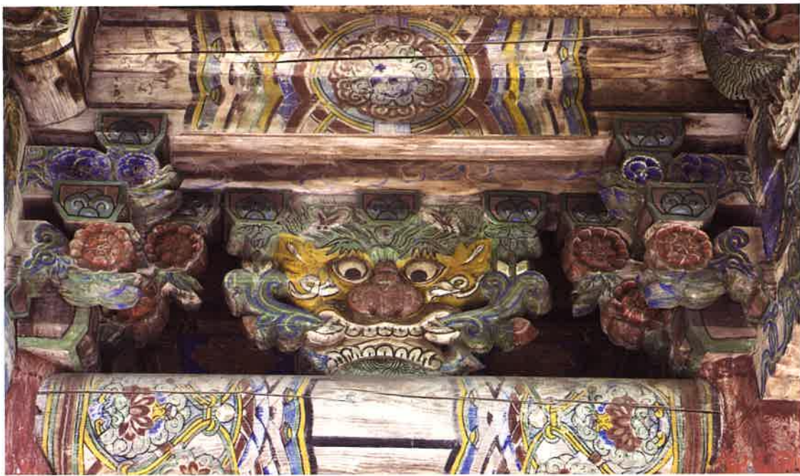
불지암 앞면 화반 1 / 佛地庵 前面 花盤 1 / front Hwaban 1, Puljiam