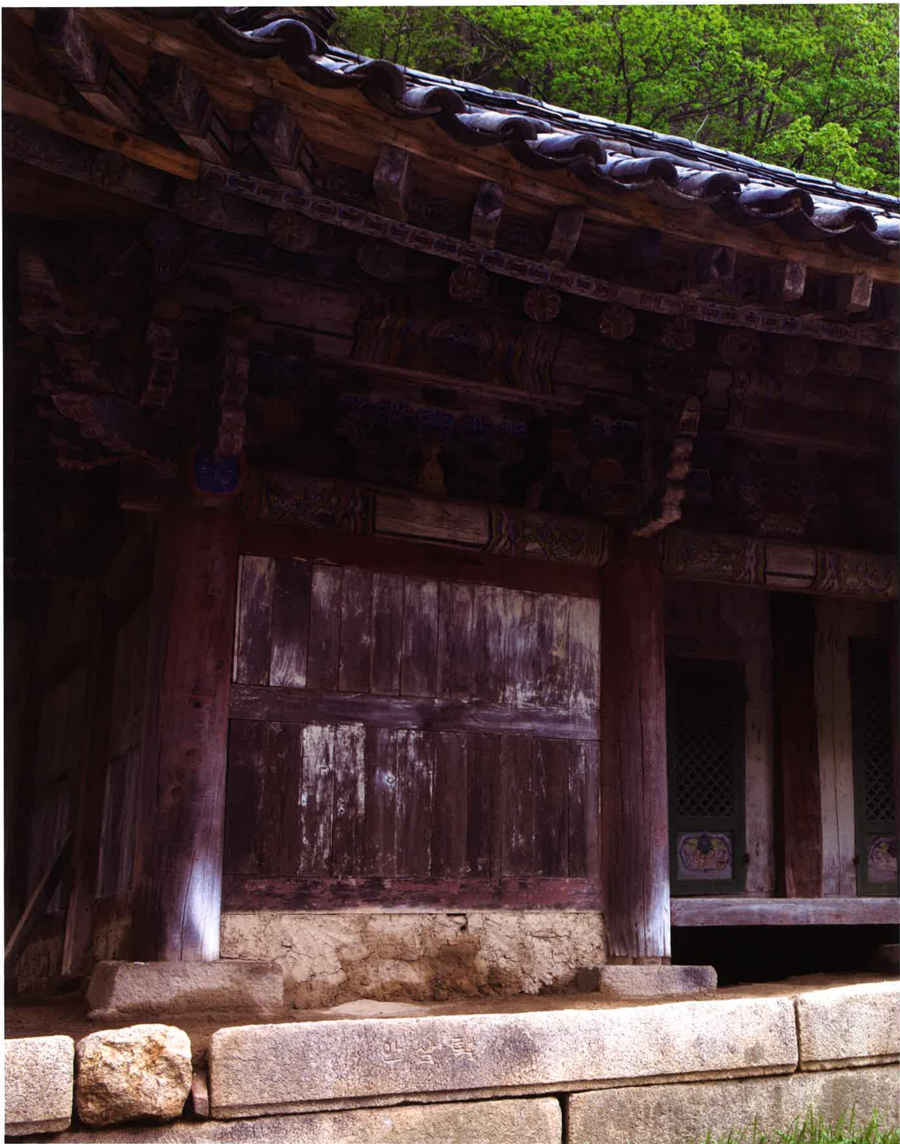
금강산 불지암은 조선 세조 때 창건됐으나 이후 폐허로 변했고, 1619년에 중건됐다고 전한다. 묘길상 인근에 있으며 앞면 6칸, 측면 3칸의 합각식 건물이다.