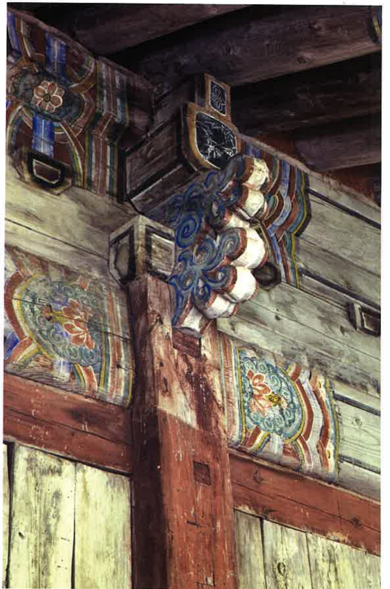
불지암 뒷면 동쪽 귀포 / 佛地庵 後面 東側 耳包 backward eastern corner brackets, Puljiam