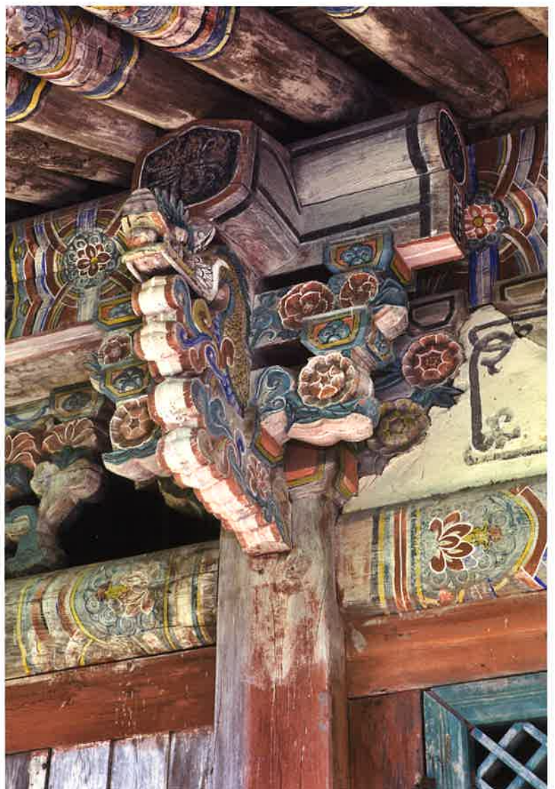
불지암 동쪽 측면 주상포 / 佛地庵 東側 柱上包 brackets above eastern columns, Puljiam