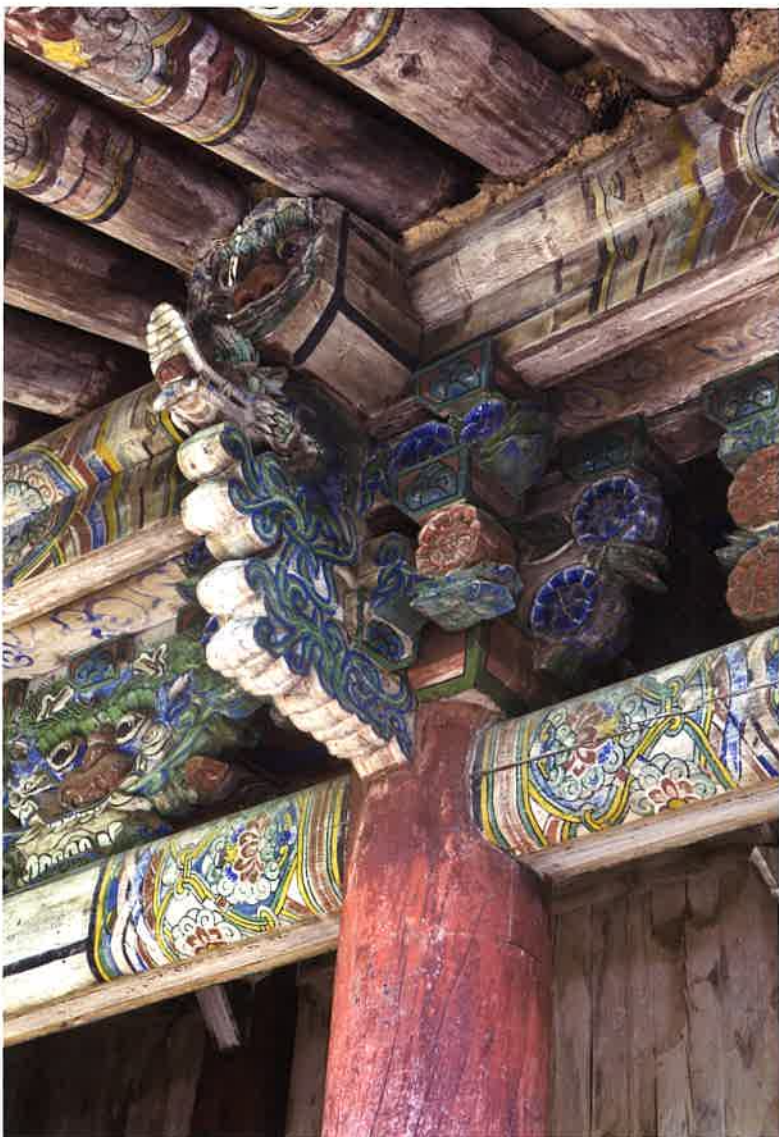
불지암 앞면 주상포 / 佛地庵 前面 柱上包 brackets above front columns, Puljiam