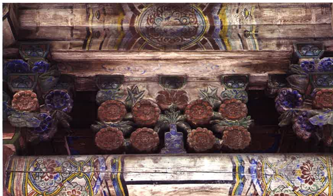
불지암 앞면 화반 3 / 佛地庵 前面 花盤 3 / front Hwaban 3, Puljiam