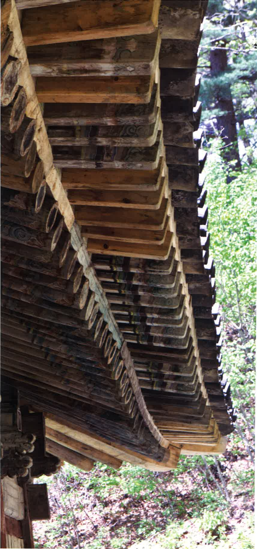
불지암 뒷면 처마와 기둥 / 佛地庵 後面 軒·平柱 / backward eaves and columns, Puljiam