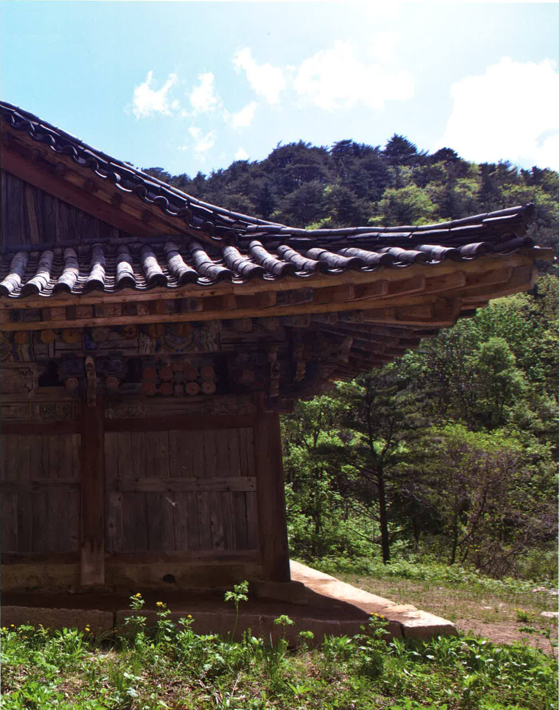
불지암 서쪽 측면 / 佛地庵 西側面 / western side, Puljiam