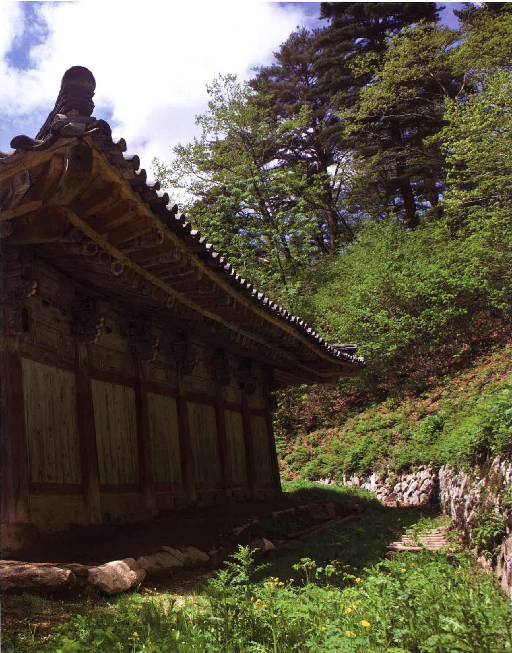
불지암 뒷면 / 佛地庵 後面 / backward side, Puljiam