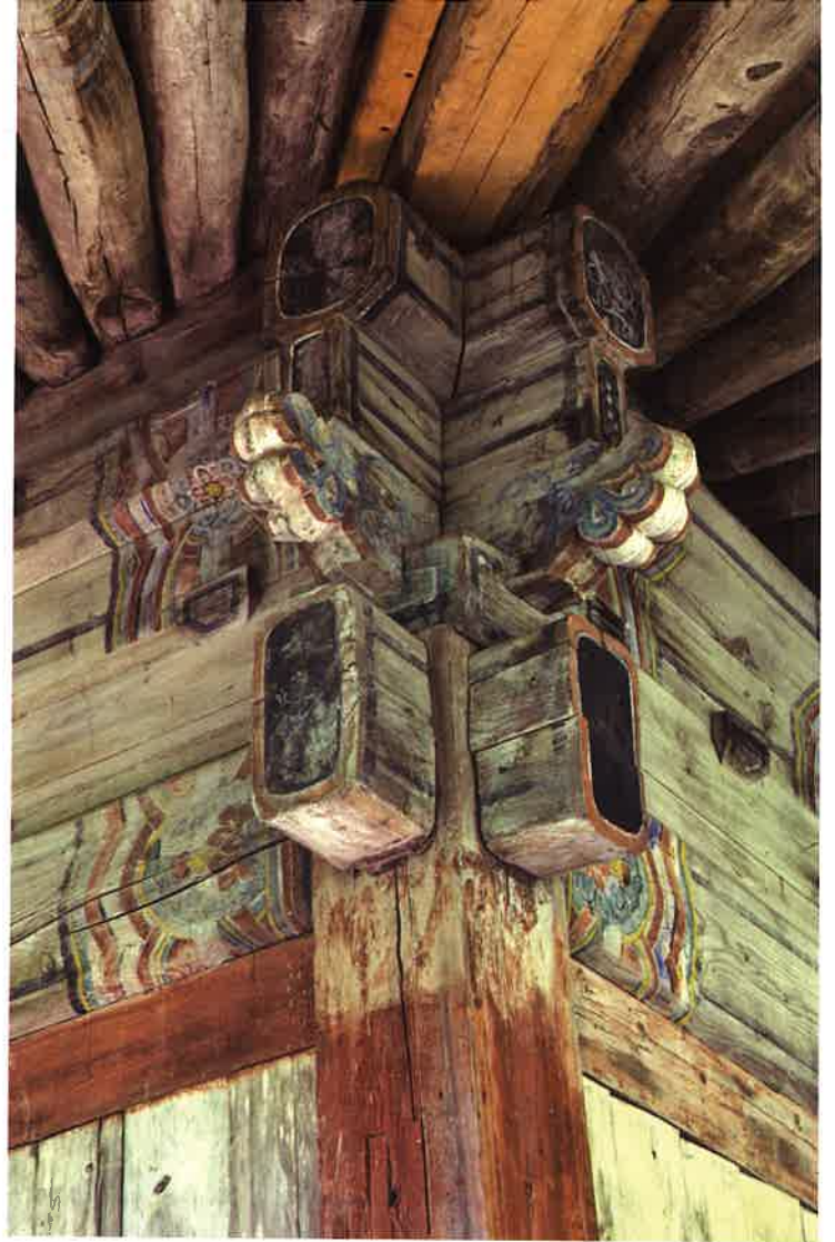
불지암 뒷면 주상포 / 佛地庵 後面 柱上包 brackets above backward columns, Puljiam