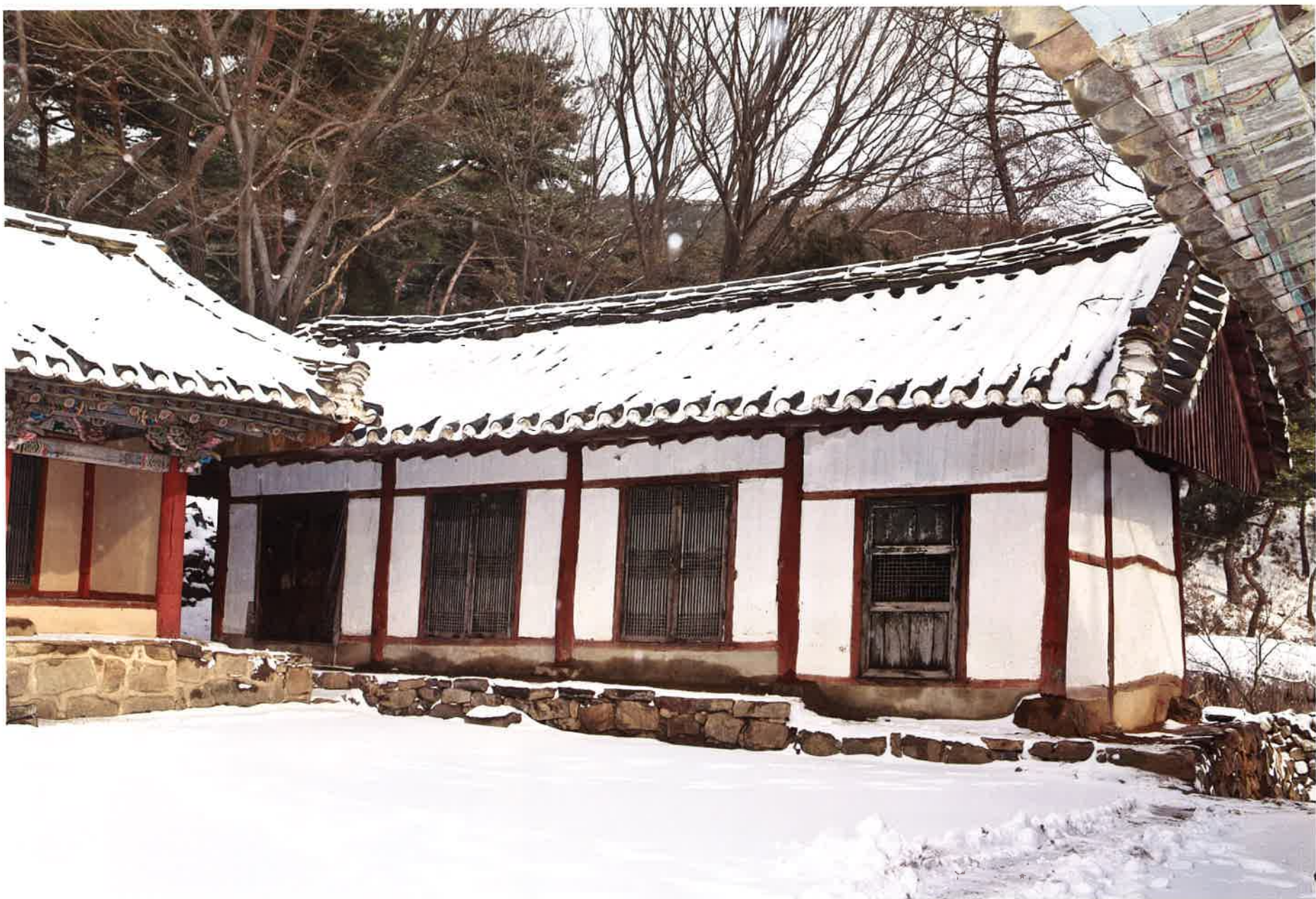
요사채 전경 / 寮舍寨 全景 / whole view, priest's residence

산신각은 원통전의 서북쪽 암벽 전면에 위치하고 있으며, 전면 1칸, 측면 1칸의 맞배집이다.