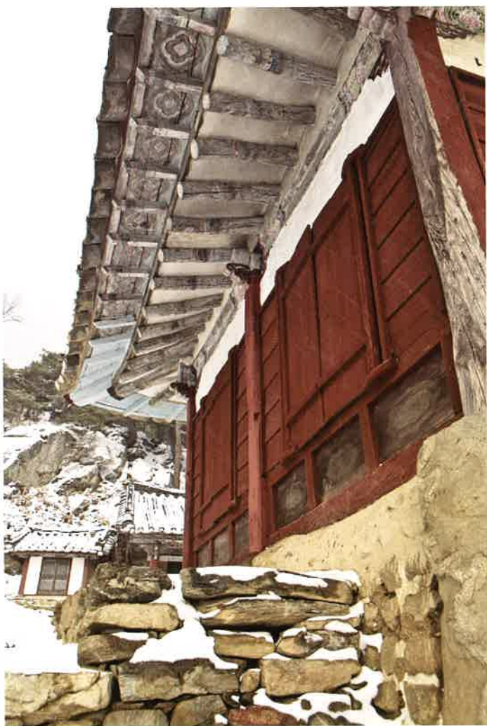
만세루 서쪽 창호 / 萬歲樓 西側 窓戶 / western doors, Manseru