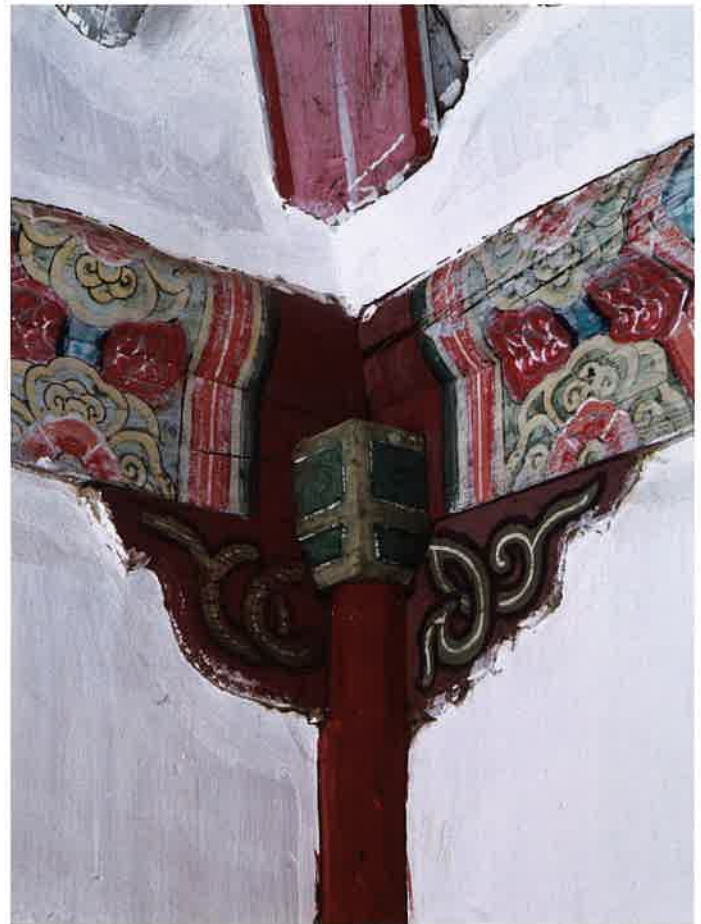
만세루 내부 귀포 / 萬歲樓 內部 耳包 / corner brackets, Manseru