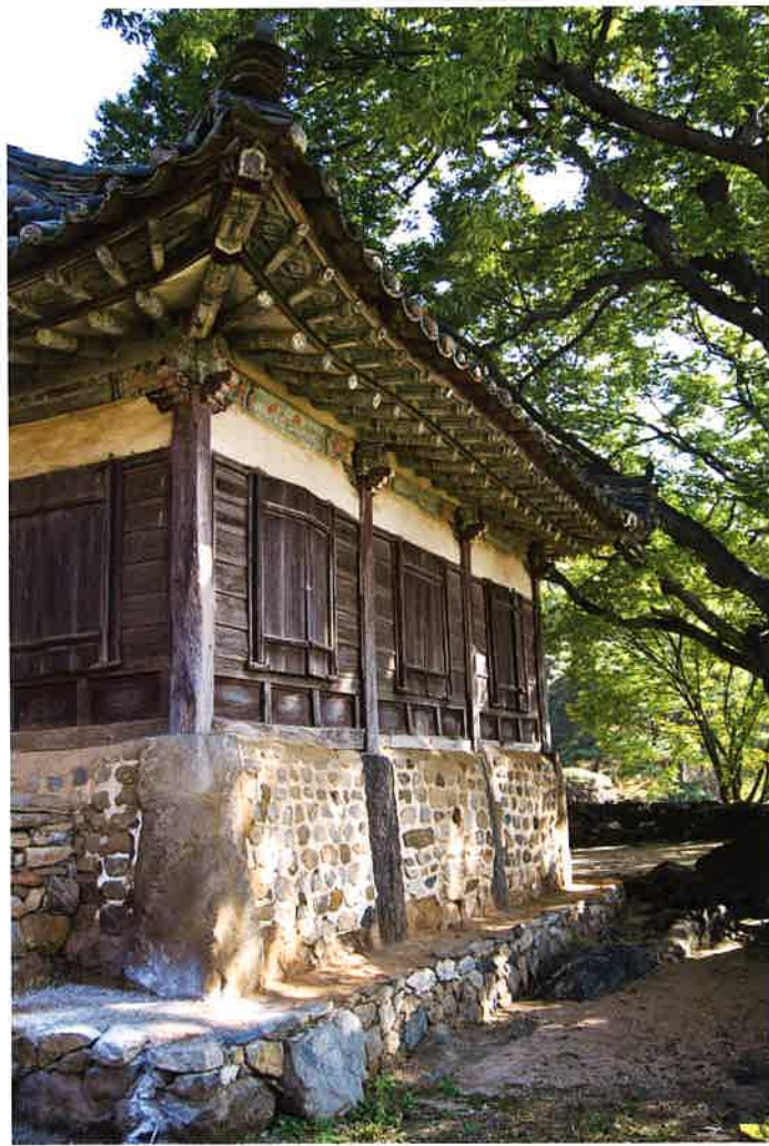
만세루 측면 / 萬歲樓 側面 / side, Manseru

만세루는 전면 3칸, 측면 2칸으로 팔작지붕이다. 3 front aspects, 2 side aspects with hipped-and-gabled roof.