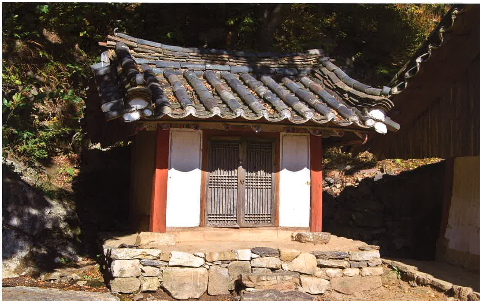
산신각 전경 / 山神閣 全景 / whole view, Sansin'gak shrine