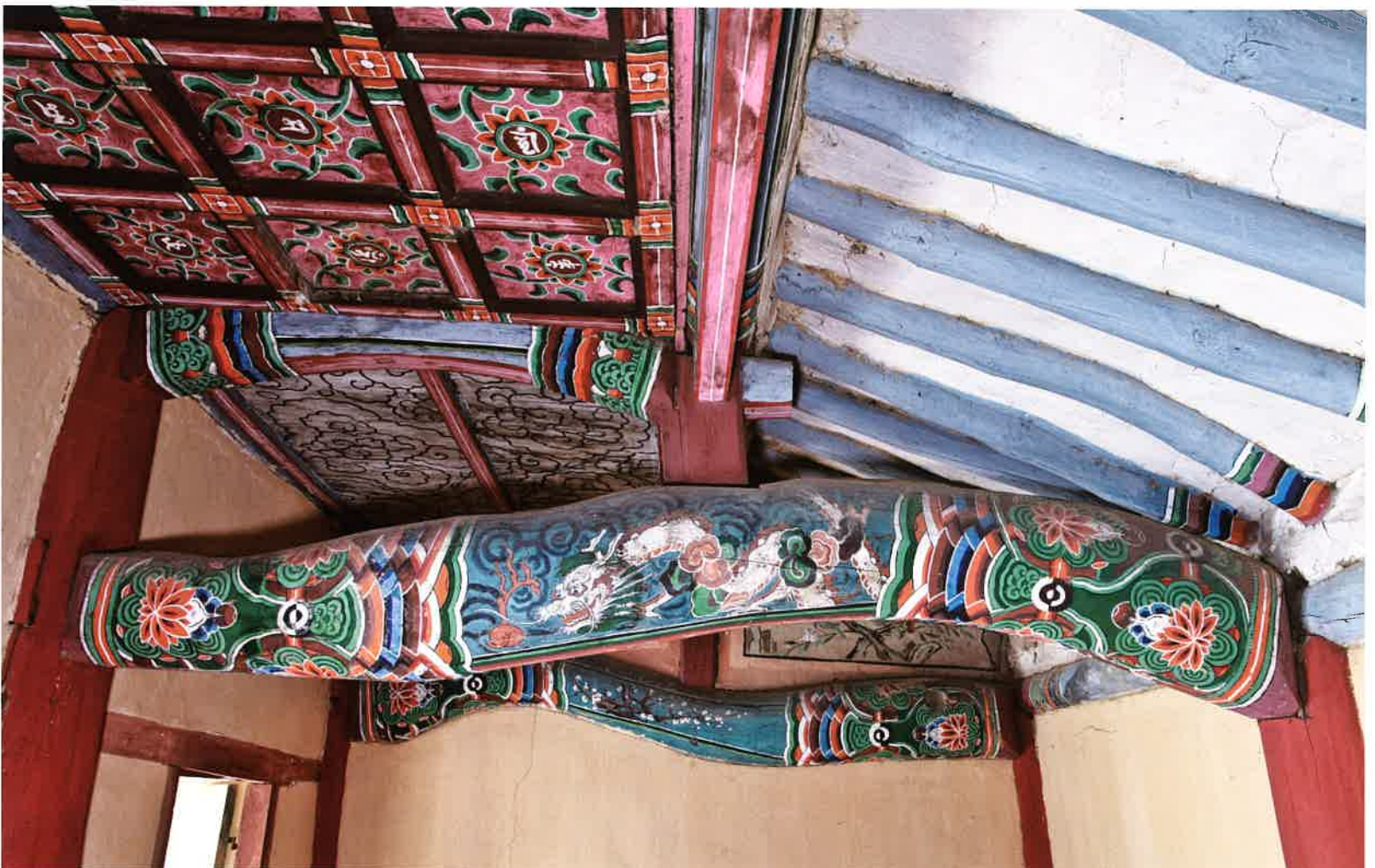
원통전 내부 대들보 2 / 圓通殿 內部 大樑 2 / main beam 2, Wont'ongjon hall