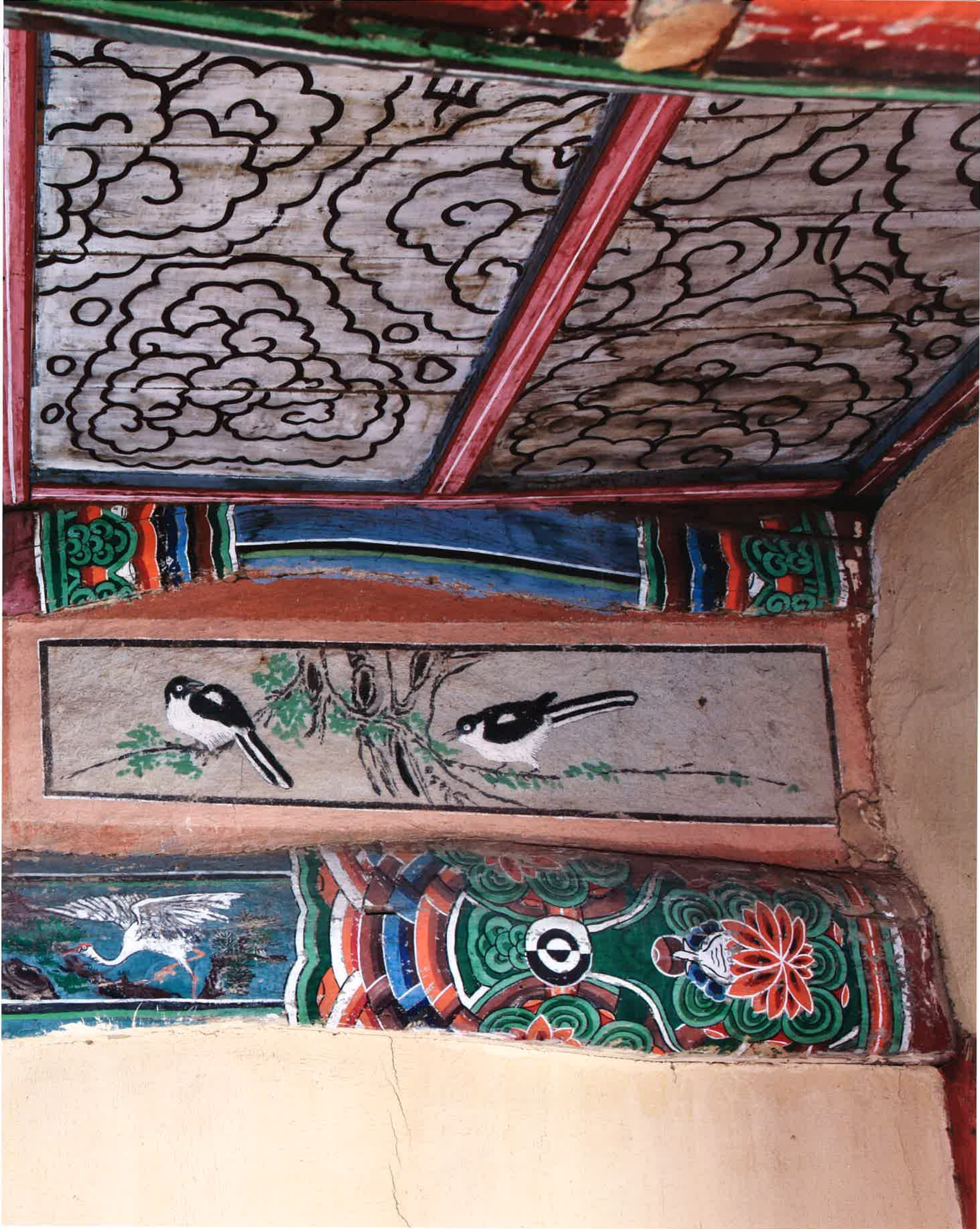
원통전 내부 대들보 3 / 圓通殿 內部 大樑 3 / main beam 3, Won'ongjon hall