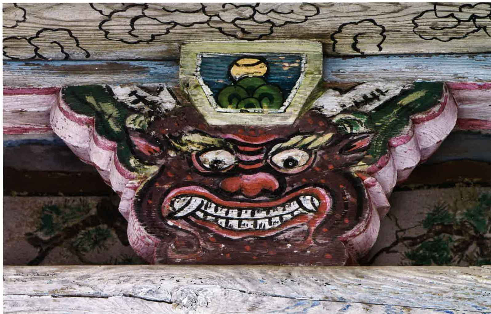
원통전 앞면 화반 / 圓通殿 前面 花盤 / front Hwaban, Wont'ongjeon hall