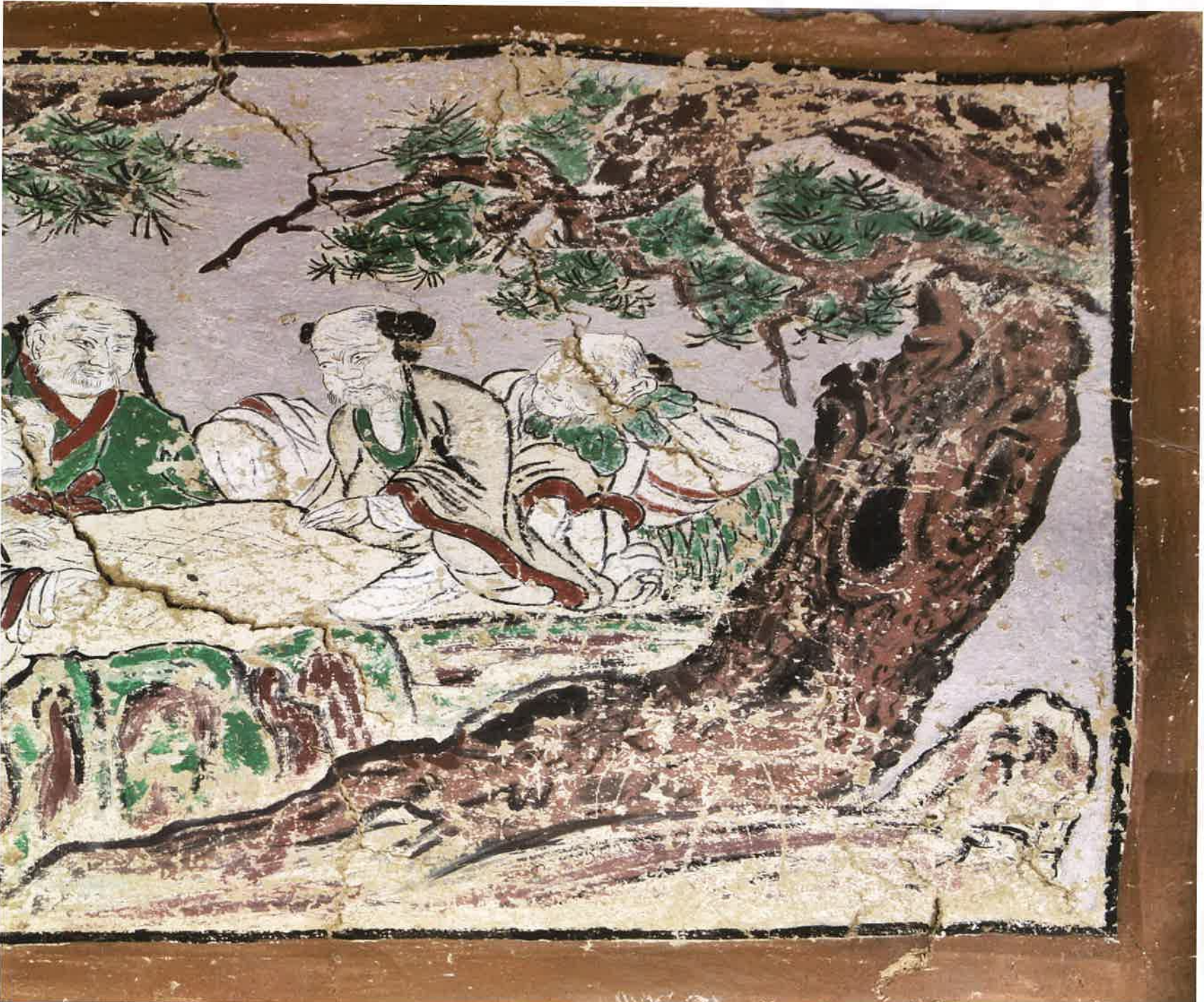
원통전 앞면 별화 2 / 圓通殿 前面 別畵 2 / attached painting 2 on front wall, Wont'ongjon hall