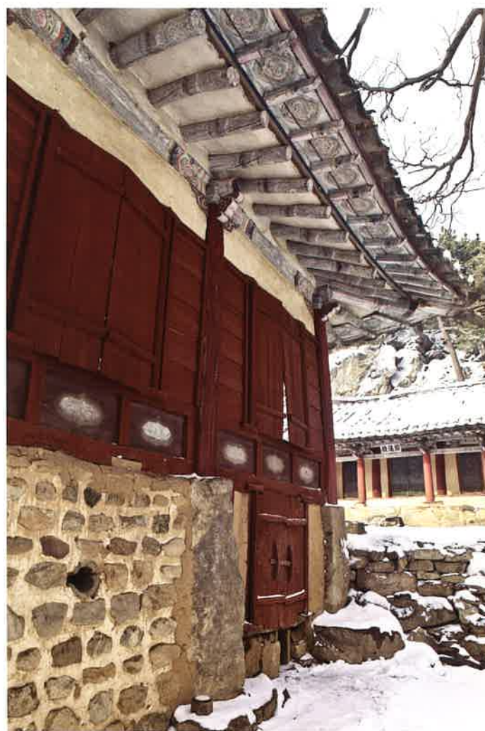
만세루 동쪽 측면 벽체 / 萬歲樓 東側 壁體 / eastern wall, Manseru