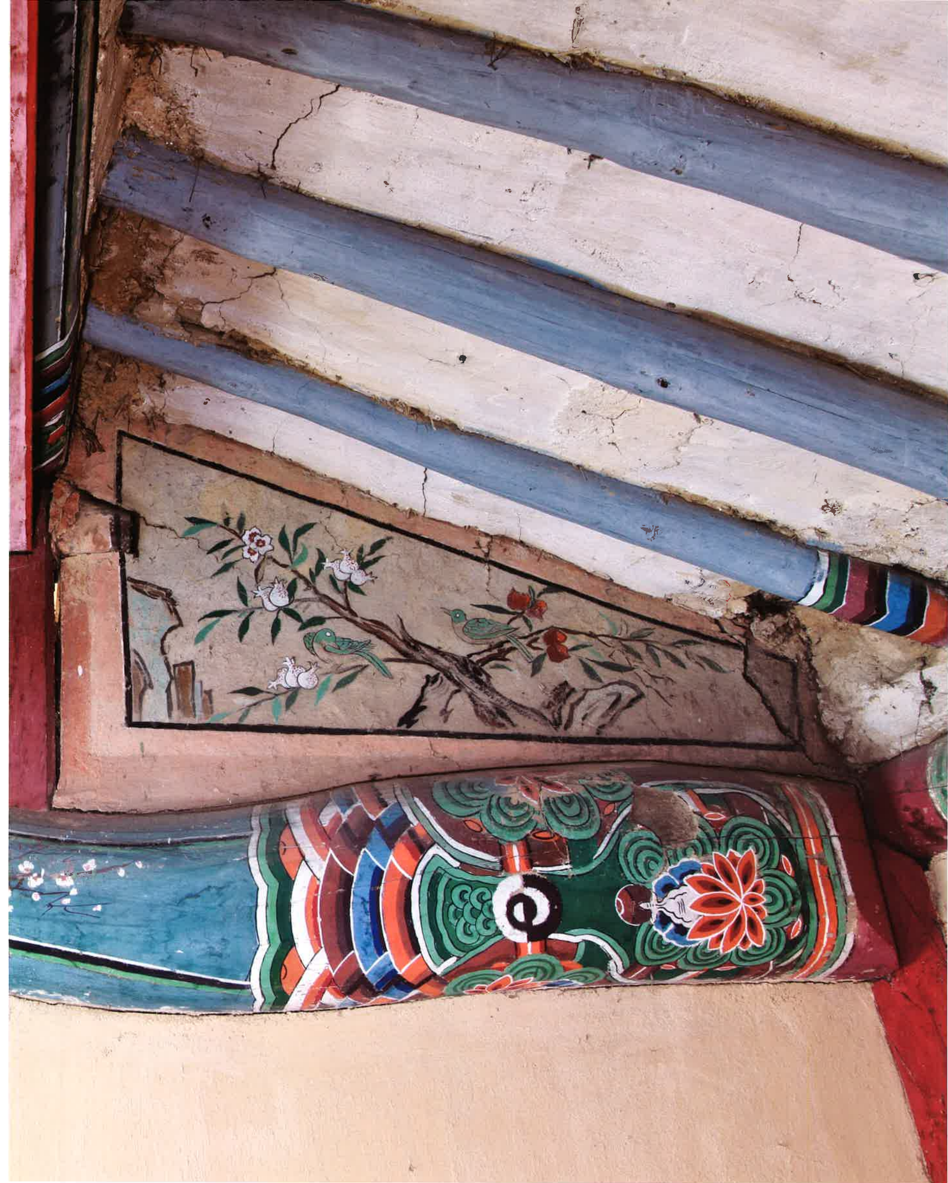
원통전 내부 대들보 4 / 圓通殿 內部 大樑 4 / main beam 4, Won'ongjon hall