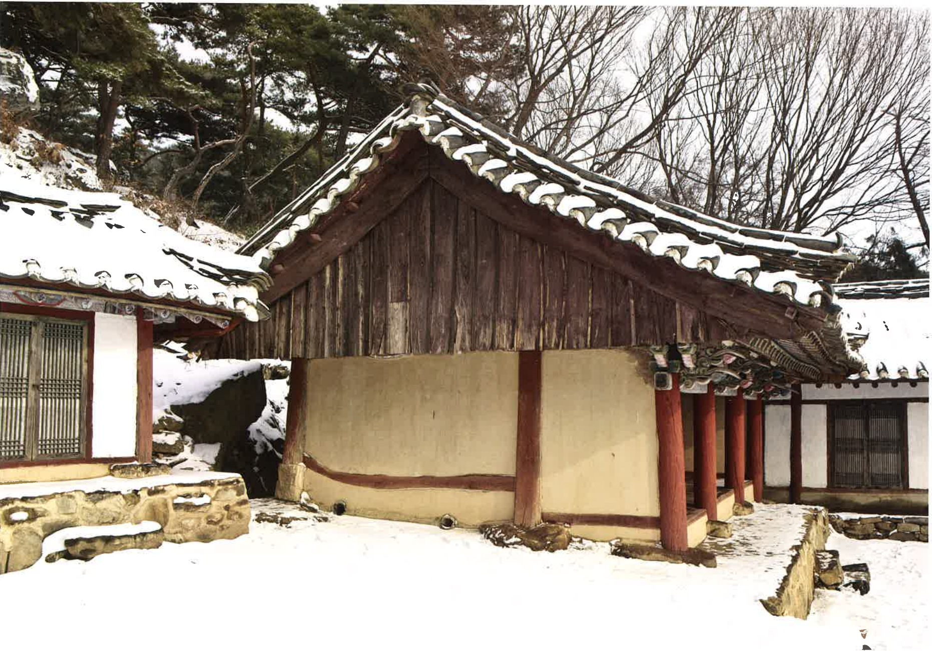
원통전 서쪽 측면 / 圓通殿 西側面 / western side, Wŏnt'ongjŏn hall