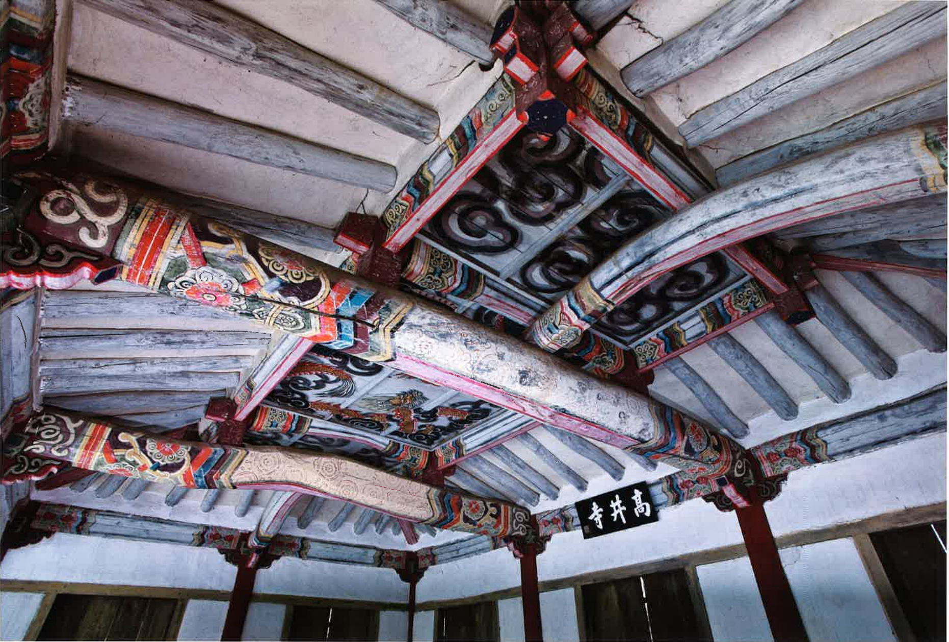
만세루 내부 반자 / 萬歲樓 內部 天障 / ceiling, Manseru