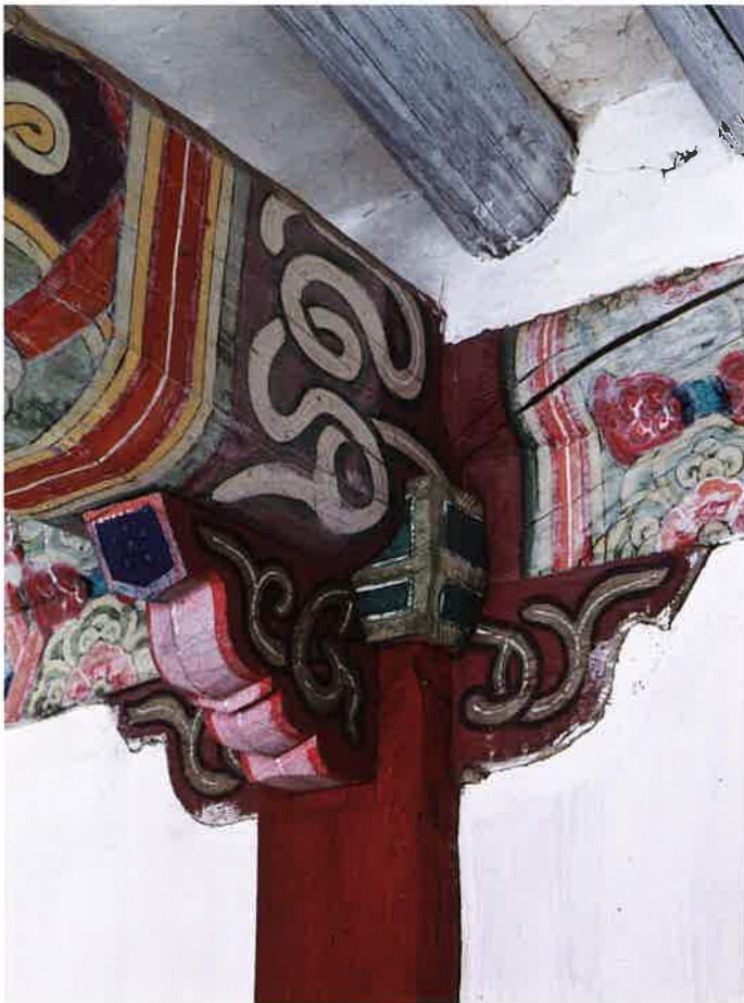
만세루 내부 주상포 / 萬歲樓 內部 柱上包 / brackets above columns, Manseru