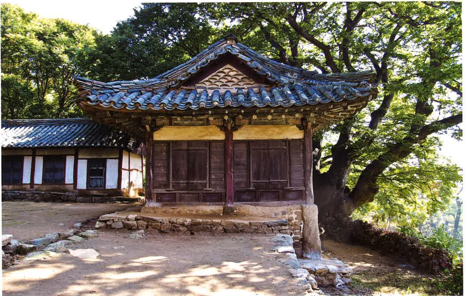
만세루 서쪽 측면 / 萬歲樓 西側面 / western side, Manseru