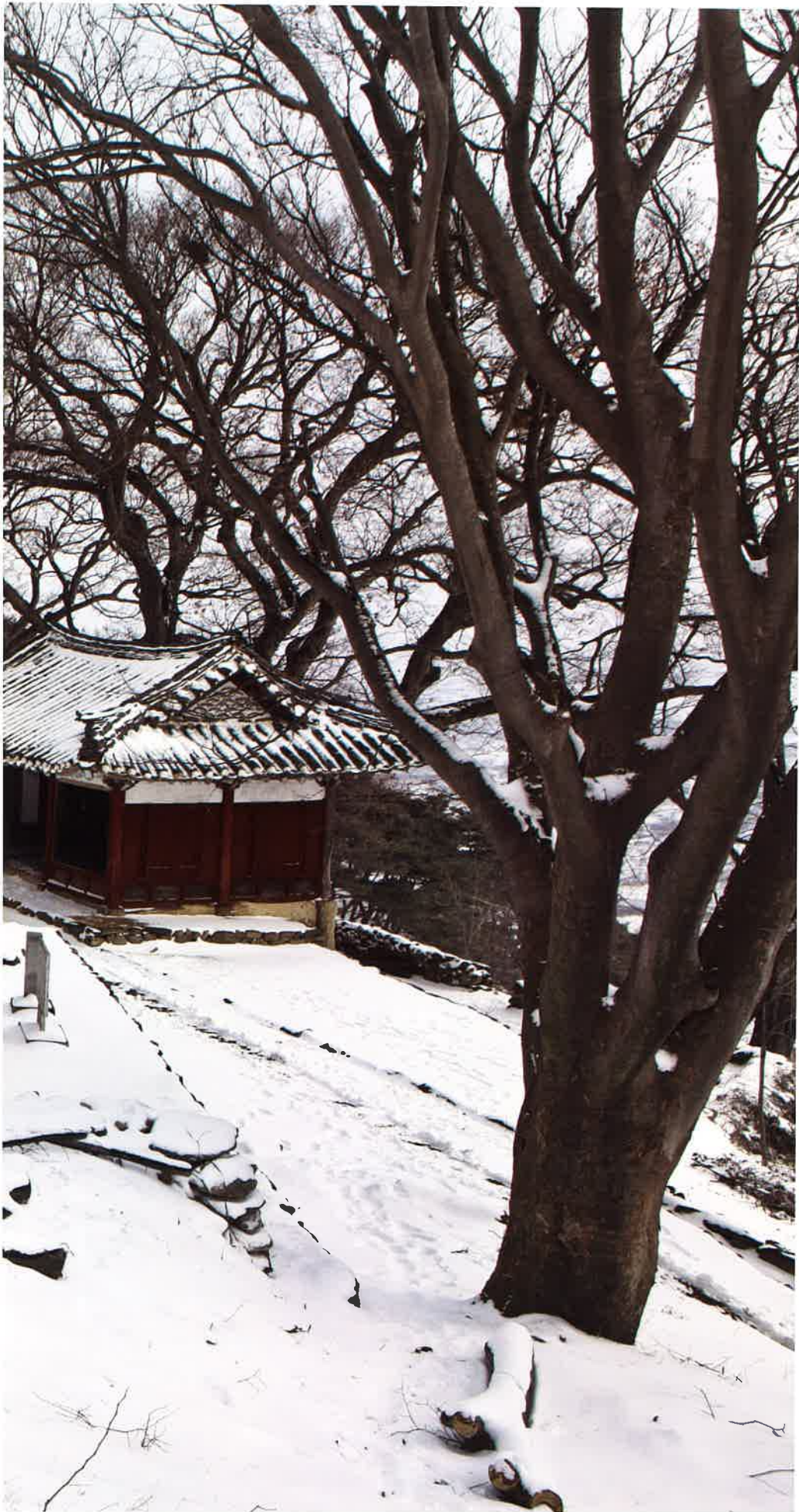
고정사 전경 / 高井寺 全景 / whole view, Kojōngsa