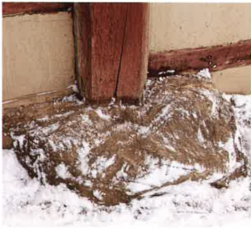
원통전 주춧돌 / 圓通殿 礎石 / plinths, Wönt'ongjön hall