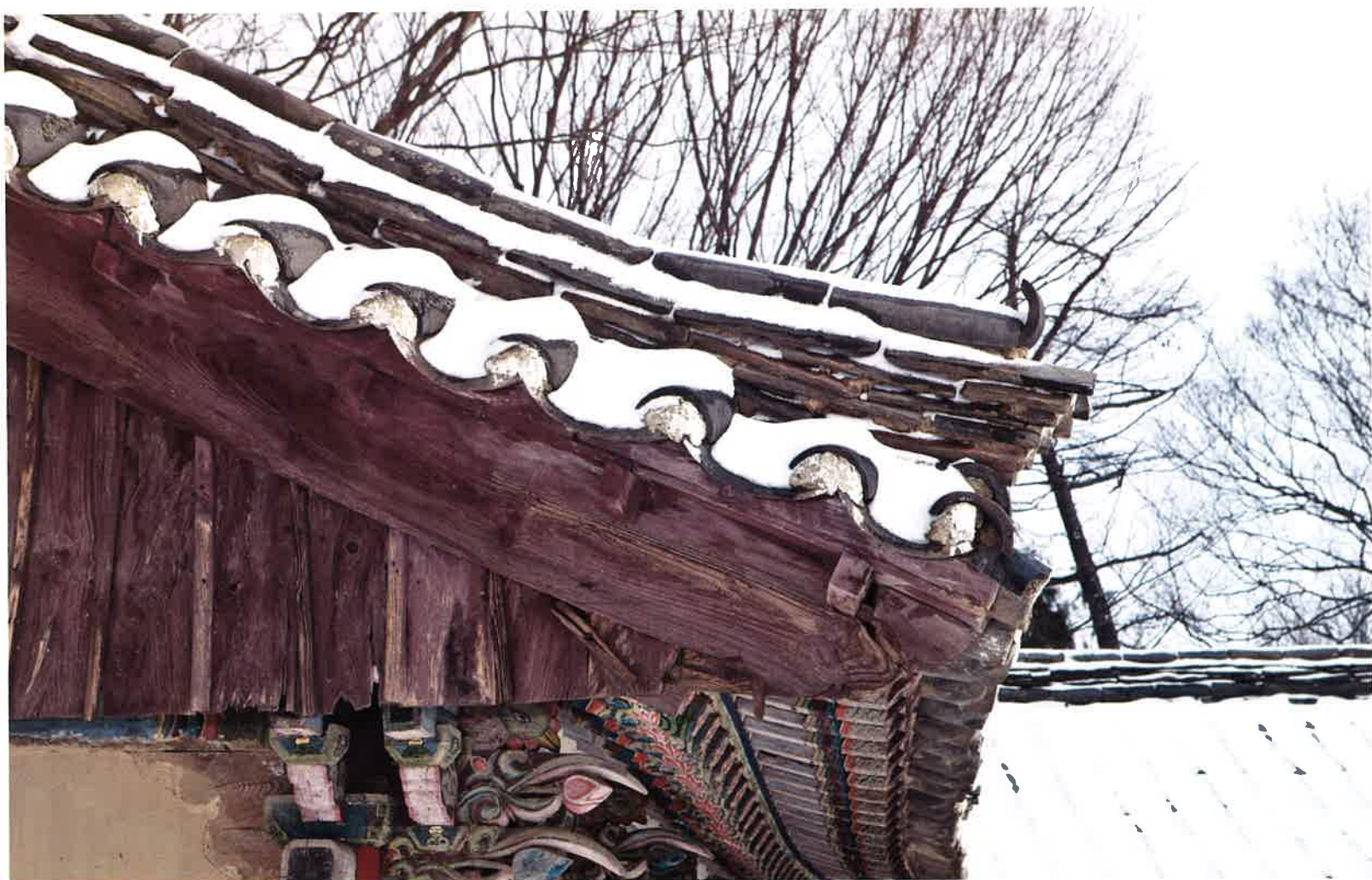
원통전 서쪽 지붕 / 圓通殿 西側 屋蓋 / western roof, Wŏn'ongjŏn hall