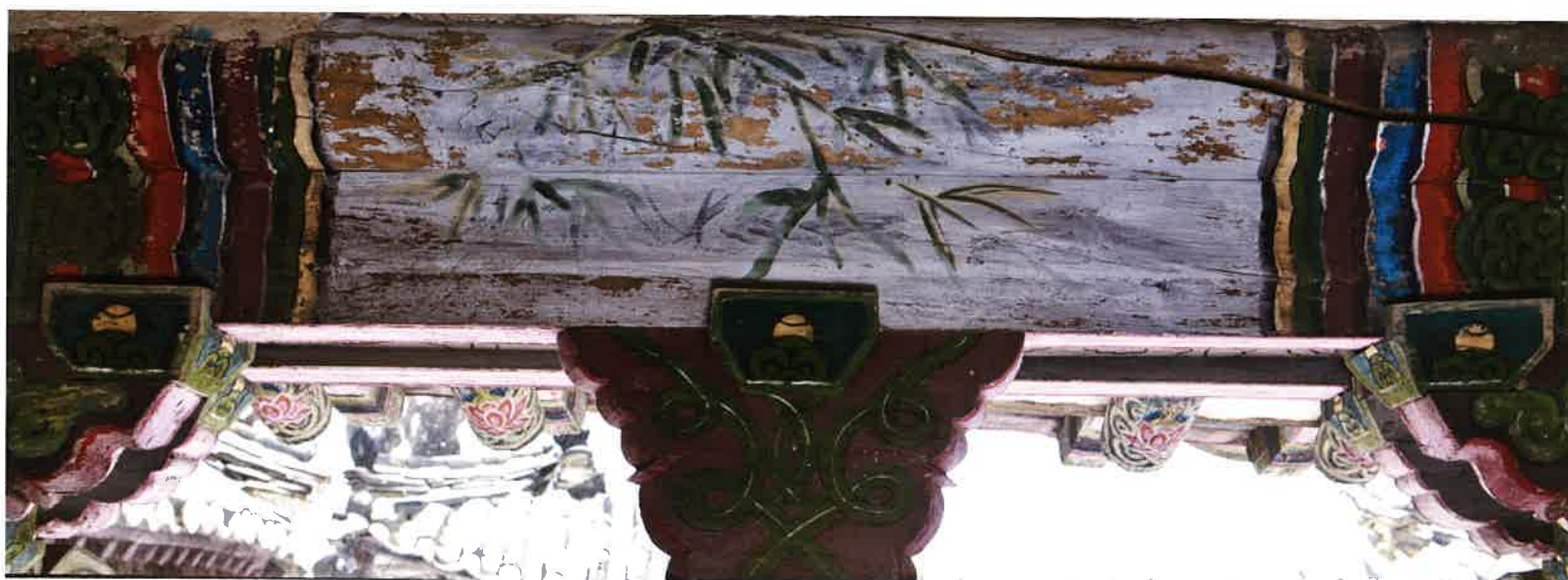
원통전 앞면 화반 3 / 圓通殿 前面 花盤 3 / front Hwaban 3, Wönt'ongjön hall