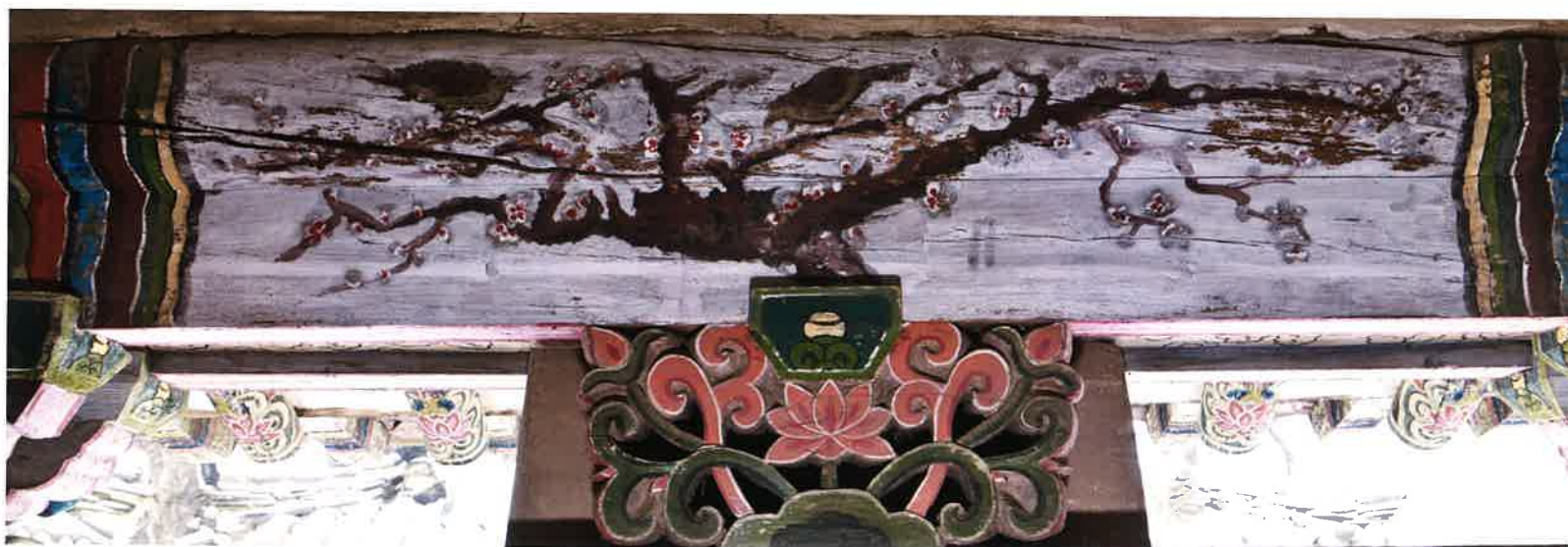
원통전 앞면 화반 2 / 圓通殿 前面 花盤 2 / front Hwaban 2, Wönt'ongjön hall