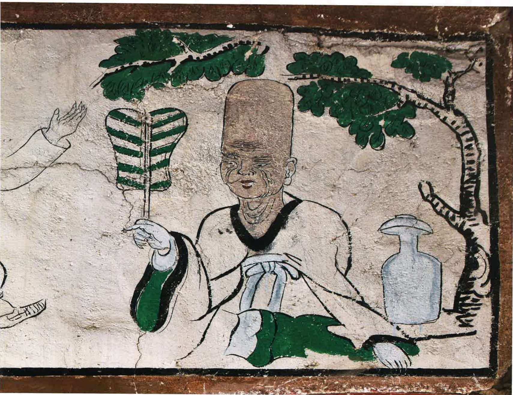
원통전 앞면 별화 3 / 圓通殿 前面 別畫 3 / attached painting 3 on front wall, Wont'ongjŏn hall