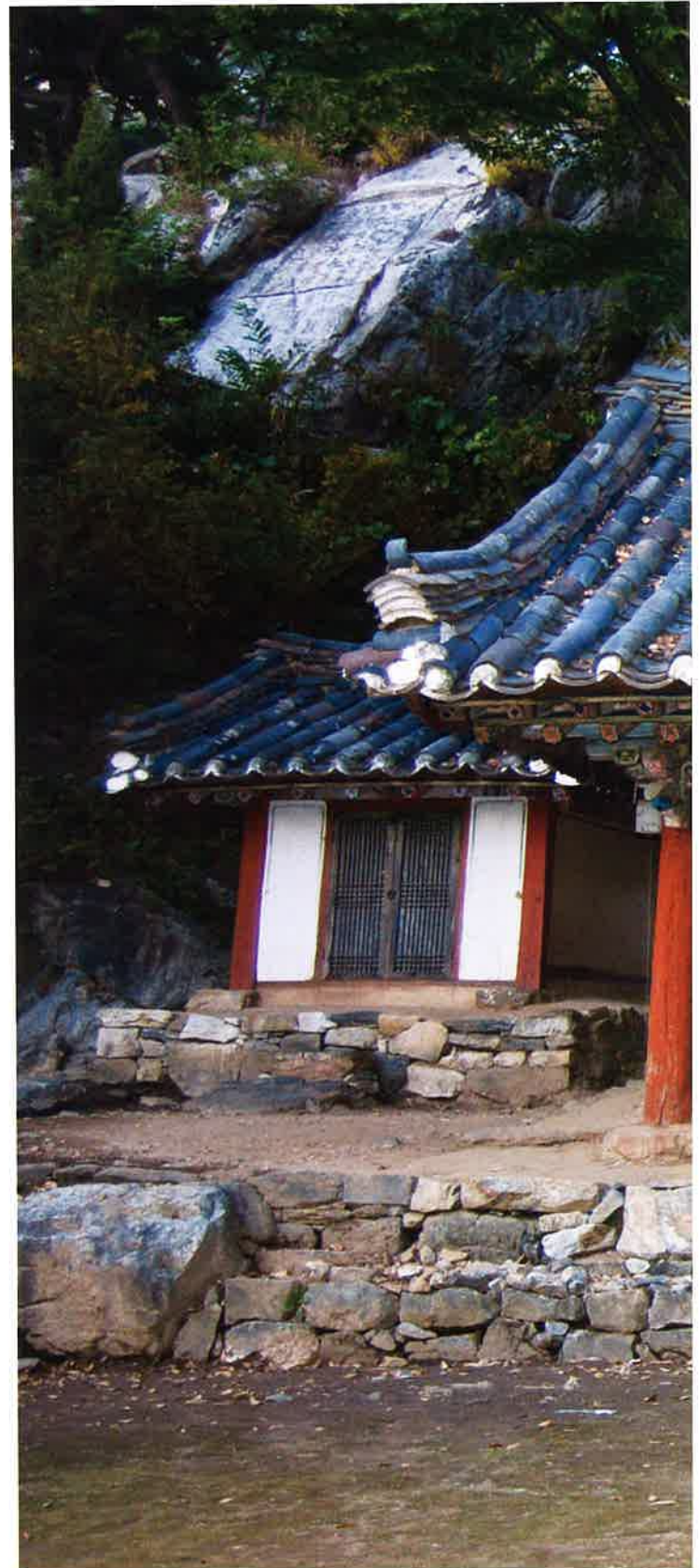
원통전 전경 / 圓通殿 全景 whole view, Wönt'ongjön hall

Wönt'ongjön hall is a simple building with gabled roof with 3 front aspects(6m), 2 side aspects(4.35m) and a narrow wooden porch running along the outside of a room is in 3 front aspects. Doors are crude with a small frame and brackets are 3-ikkong style. There is a Hwaban between columns. It's unique that Wönt'ongjön hall is the main hall in temple.