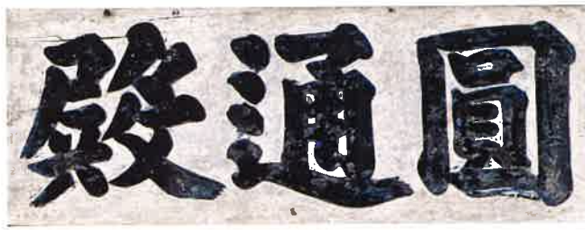
원통전 편액 / 圓通殿 扁額 / tablet, Wönt'ongjön hall

원통전은 정면 3칸(6m), 측면 2칸(4.35m)의 소박한 배집건물인데, 정면 3칸에는 툇마루를 형성했다. 문은 모두 세살문으로 검소하게 꾸며졌으나 공포는 3익공이다. 기둥 사이에는 화반을 설치했다. 중심 전각이 관음보살을 안치한 원통전인 것은 보기 드문 현상이다.