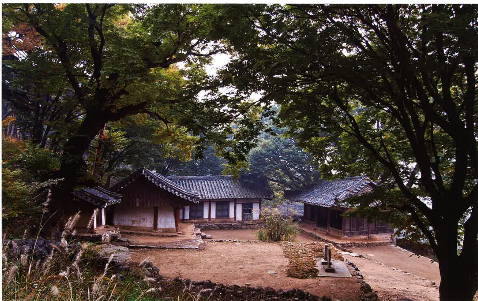
고정사 전경 / 高井寺 全景 / whole view, Kojongsa