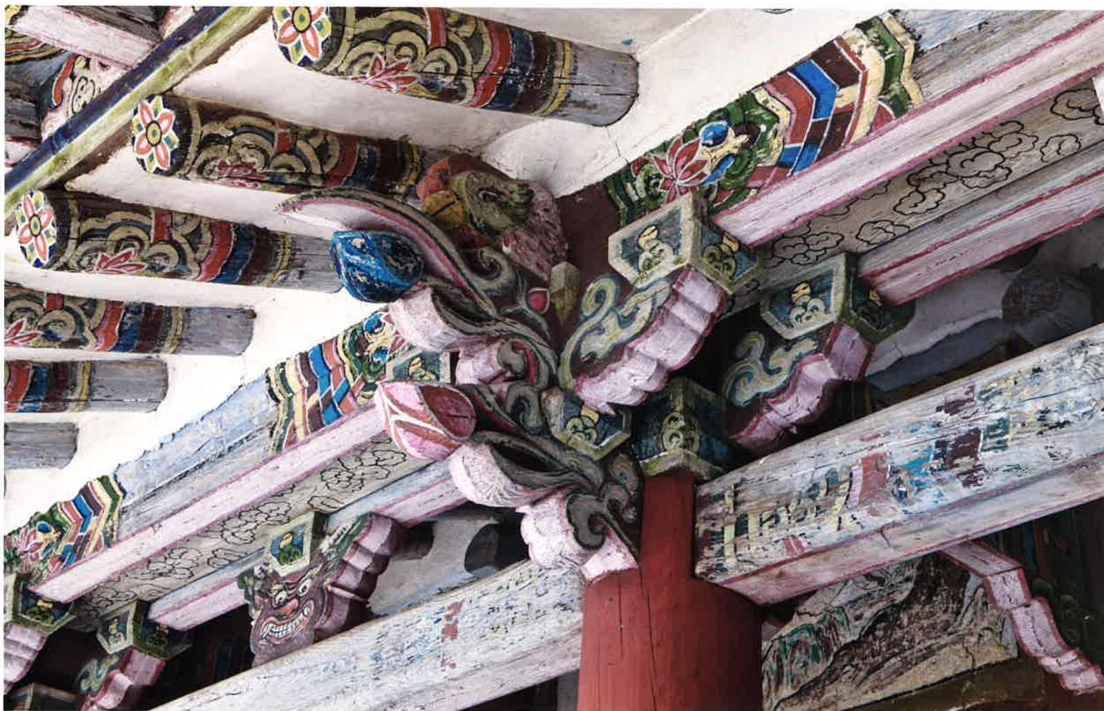
원통전 앞면 주상포 / 圓通殿 前面 柱上包 / brackets above front columns, Wont'ongjon hall