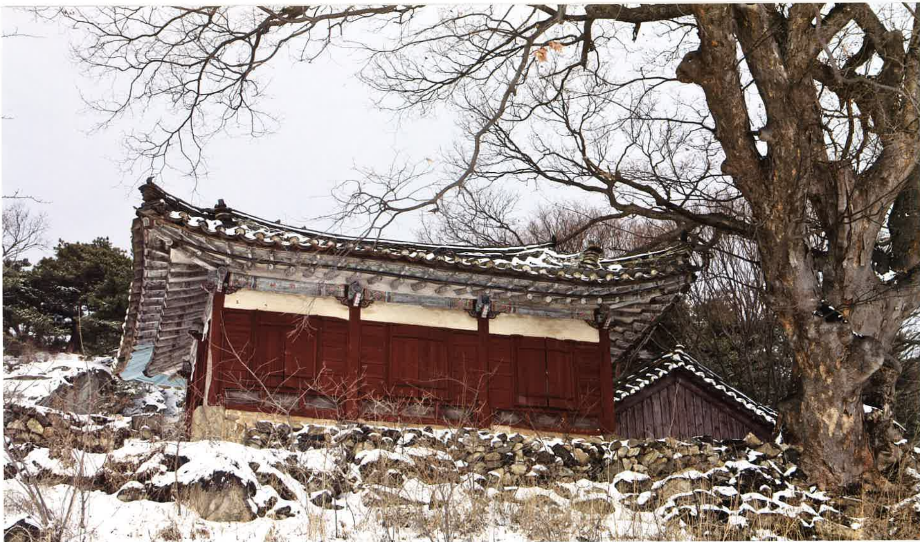
만세루 앞면 / 萬歲樓 前面 / front, Manseru