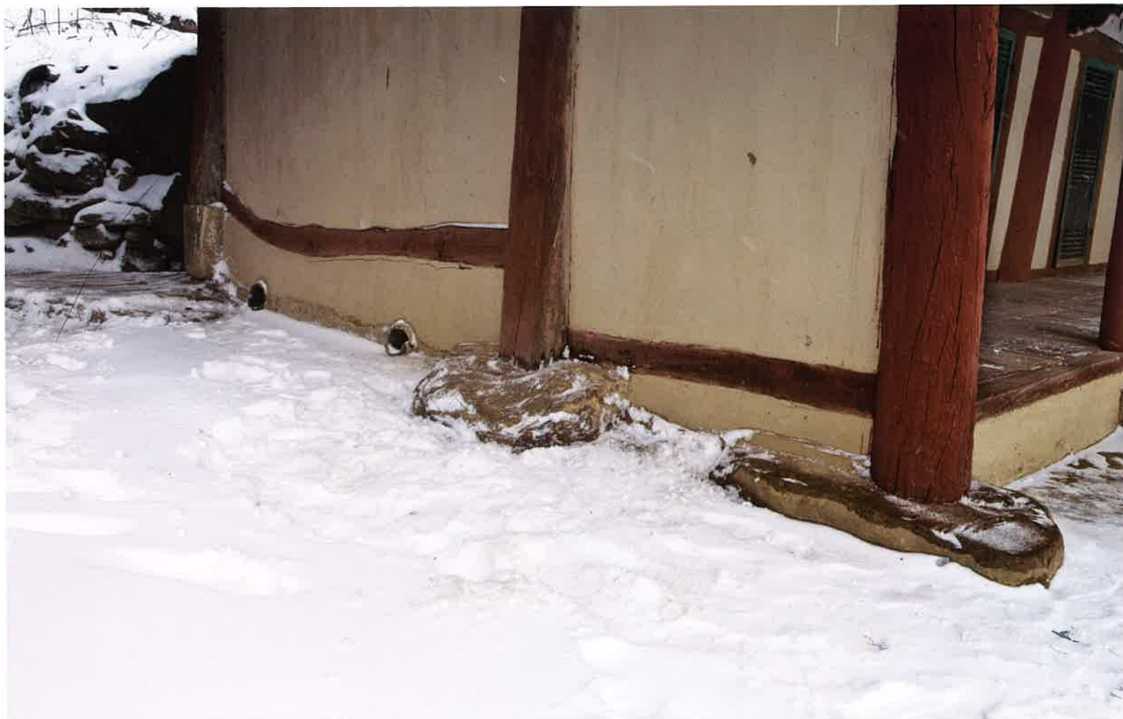
원통전 서쪽 측면 주춧돌 / 圓通殿 西側 礎石 / western plinths, Wŏn'ongjŏn hall