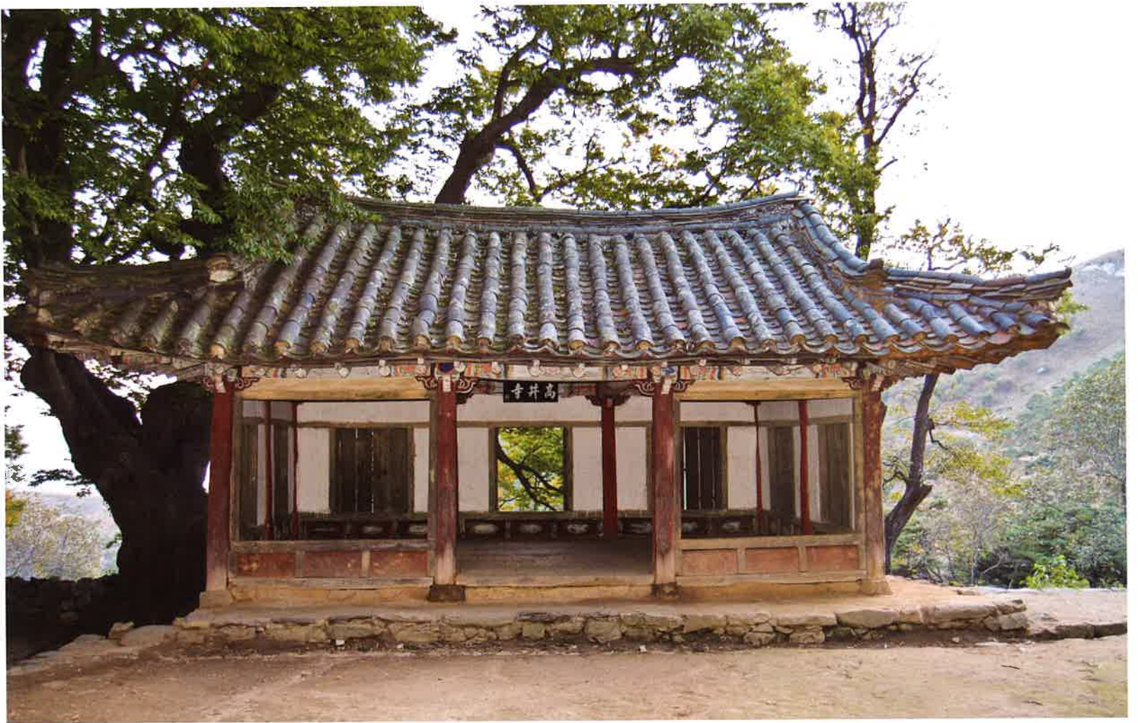
만세루 뒷면 / 萬歲樓 後面 / backward side, Manseru