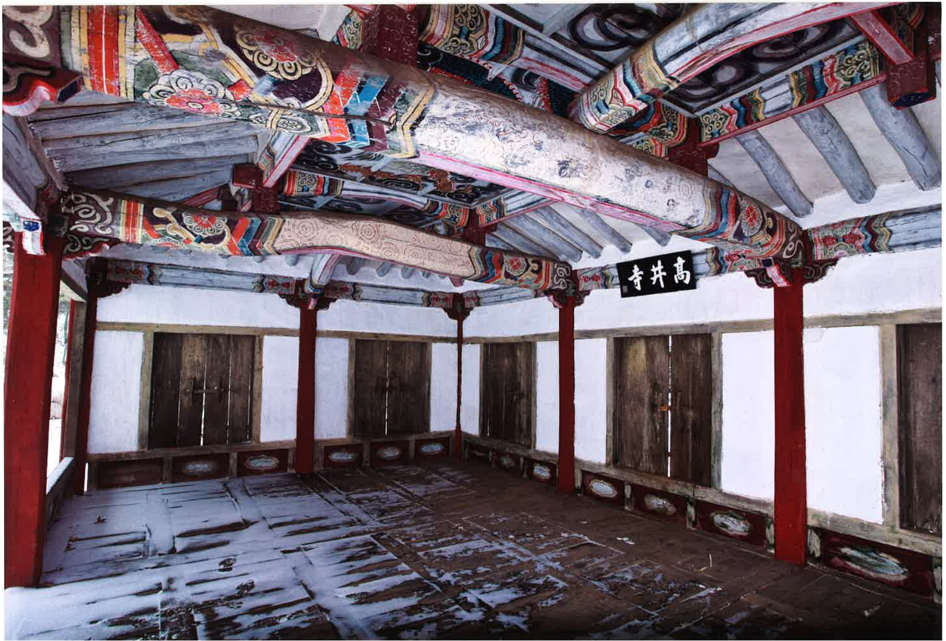
만세루 내부 전경 / 萬歲樓 內部 全景 / inside whole view, Manseru