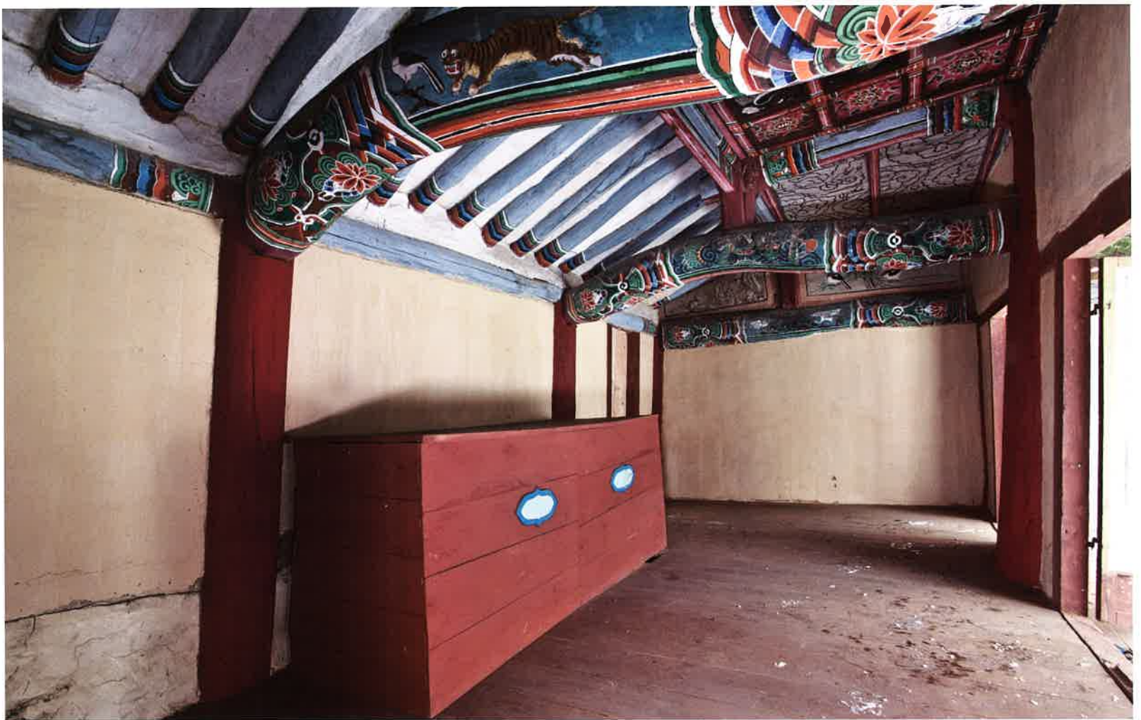
원통전 내부 전경 / 圓通殿 內部 全景 / inside whole view, Wont'ongjŏn hall