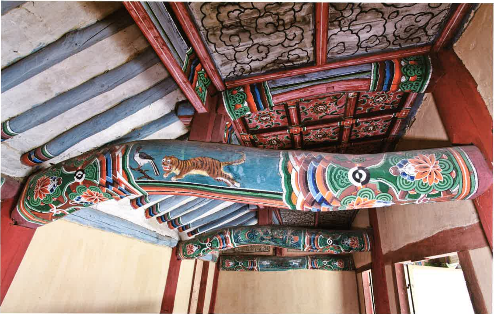
원통전 내부 대들보 1 / 圓通殿 內部 大樑 1 / main beam 1, Wont'ongjon hall