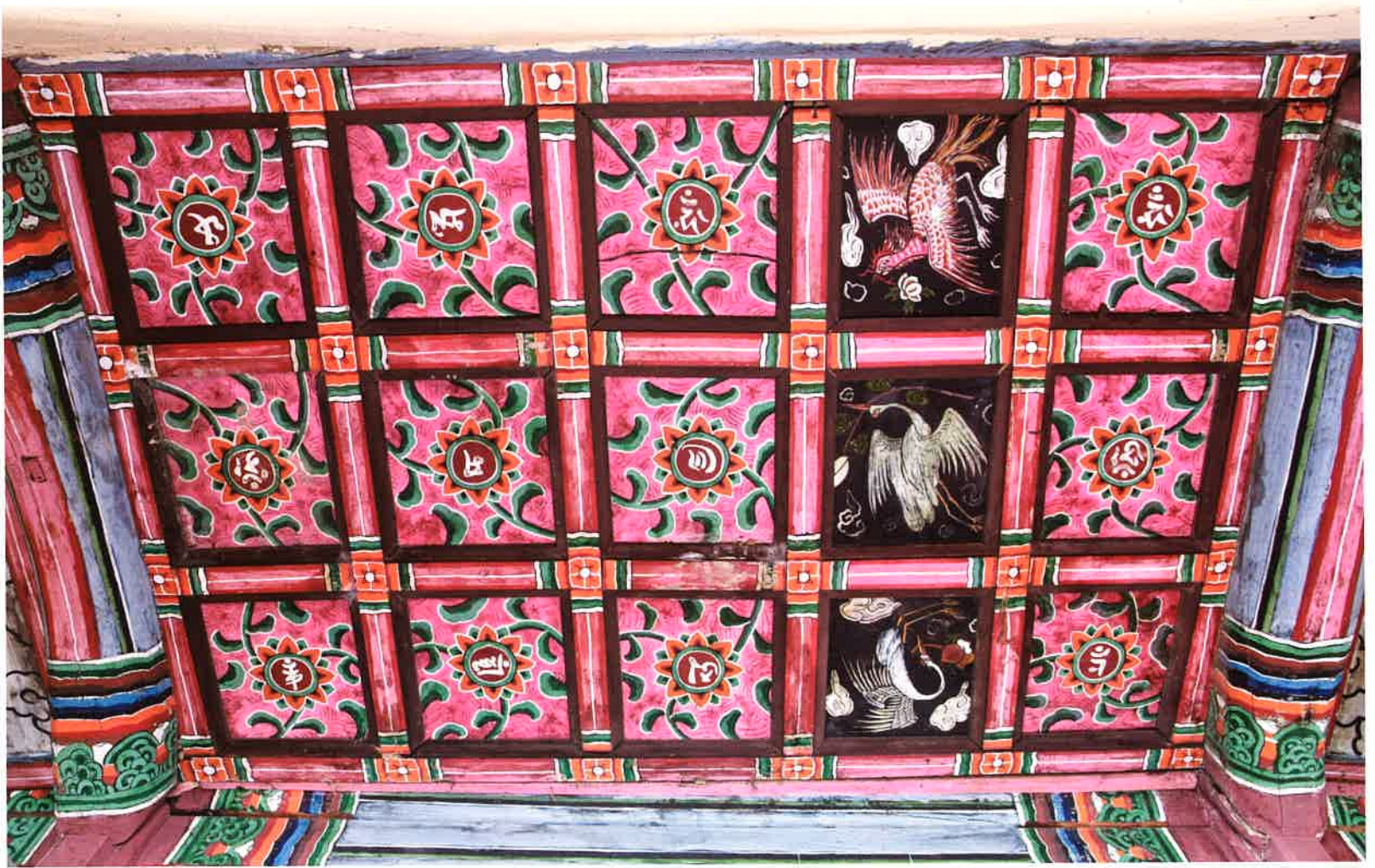
원통전 내부 반자 / 圓通殿 內部 天障 / ceiling, Wont'ongjŏn hall