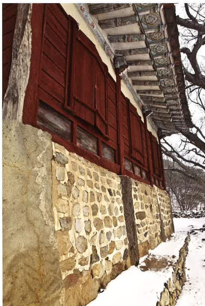
만세루 앞면 창호 / 萬歲樓 前面 窓戶 / front windows, Manseru