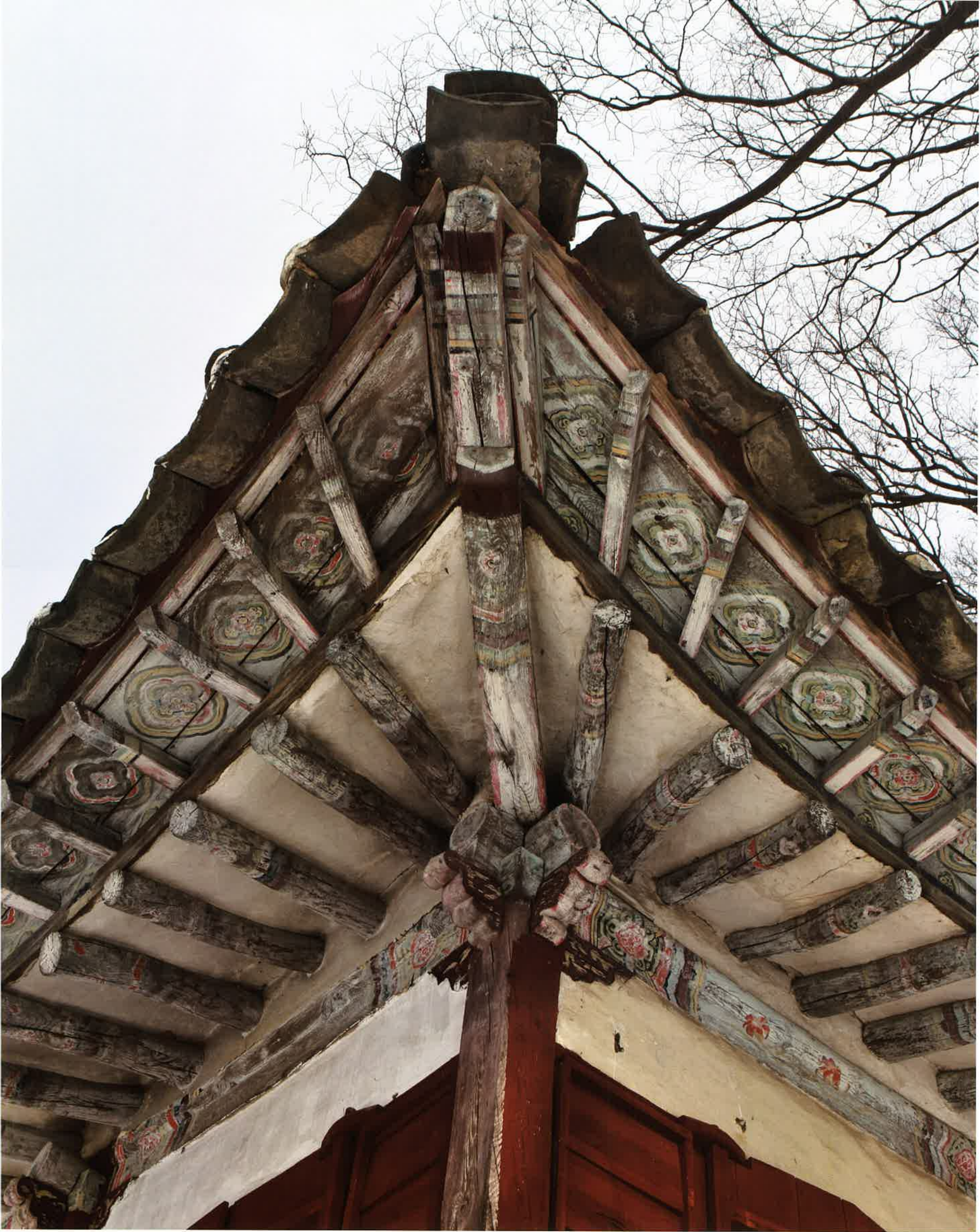
만세루 추녀 / 萬歲樓 春舌 / protruding corners of eaves, Manseru