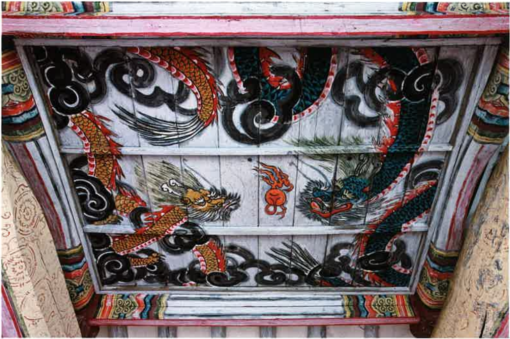
만세루 반자 별화 / 萬歲樓 天障 別畵 / attached painting on ceiling, Manseru