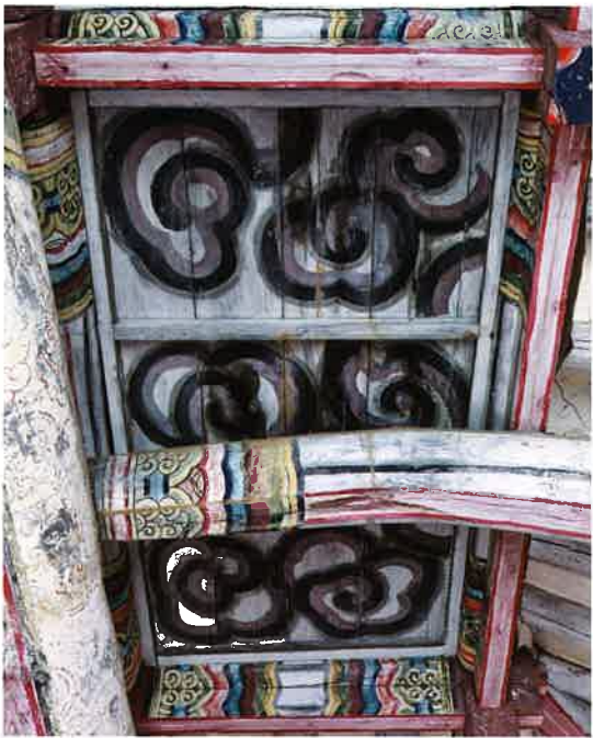
만세루 반자 문양 / 萬歲樓 天障 文樣 / ceiling pattern, Manseru