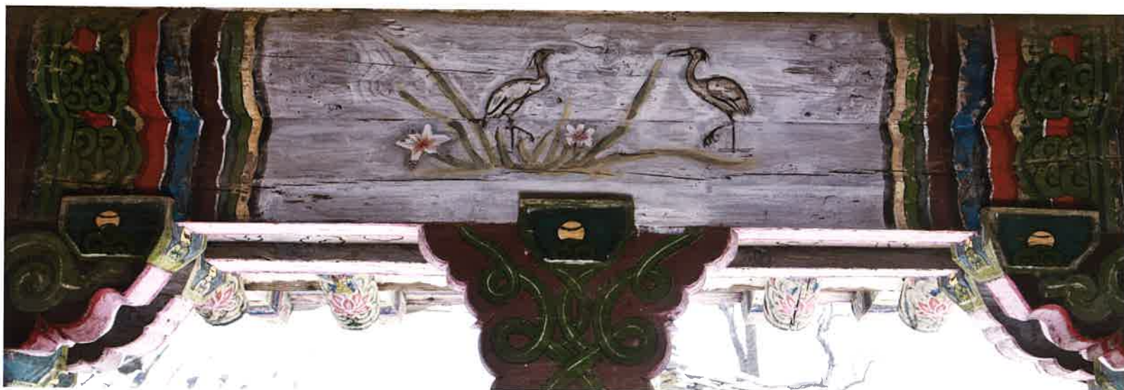
원통전 앞면 화반 1 / 圓通殿 前面 花盤 1 / front Hwaban 1, Wönt'ongjön hall