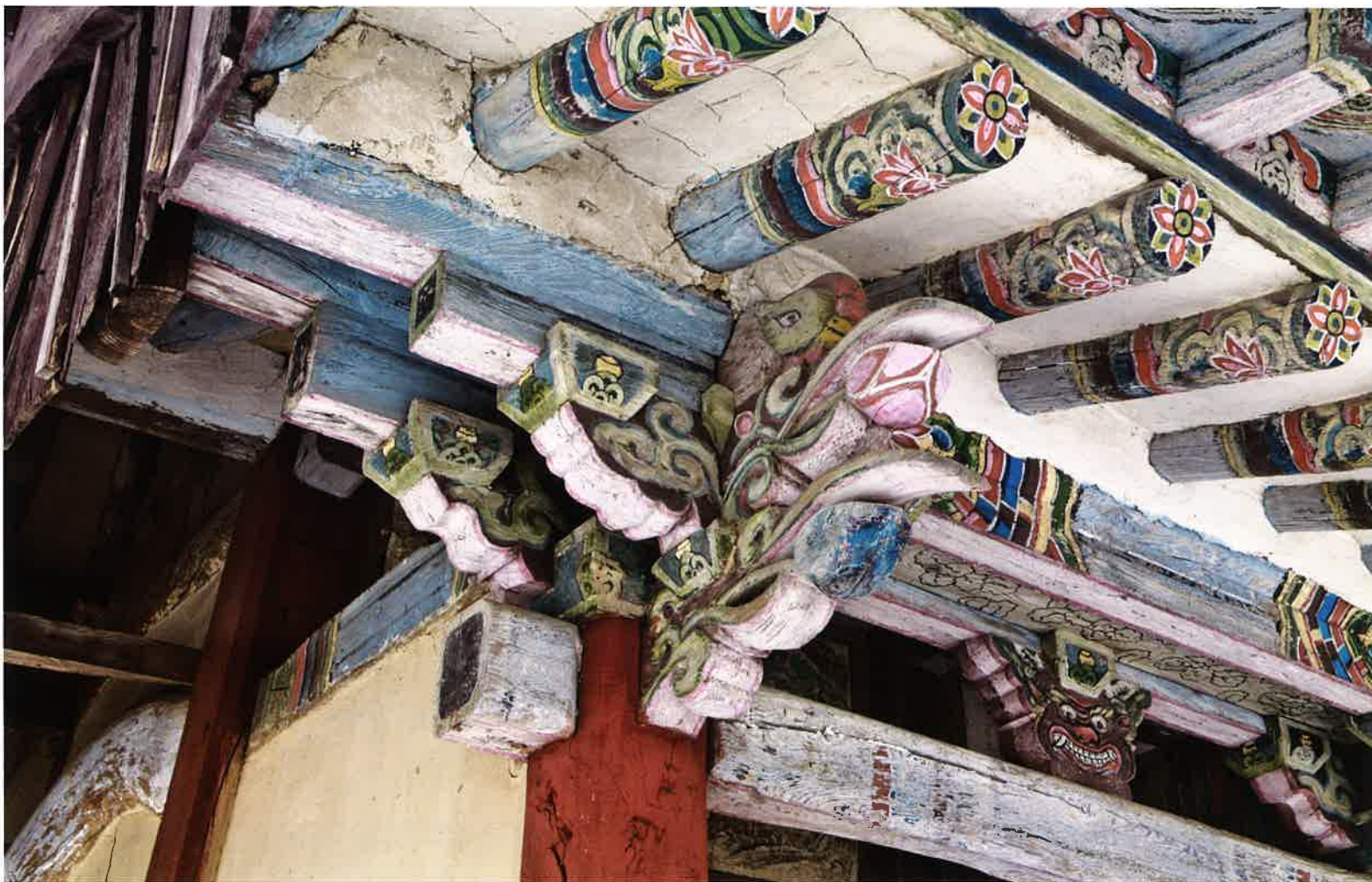
원통전 앞면 서쪽 귀포 / 圓通殿 前面 西側 耳包 / western corner brackets, Wont'ongjon hall