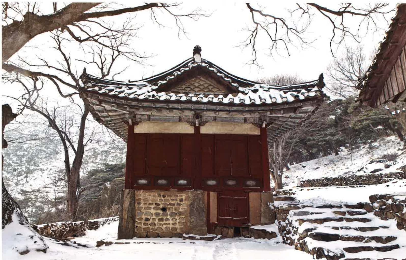
만세루 동쪽 측면 / 萬歲樓 東側面 / eastern side, Manseru