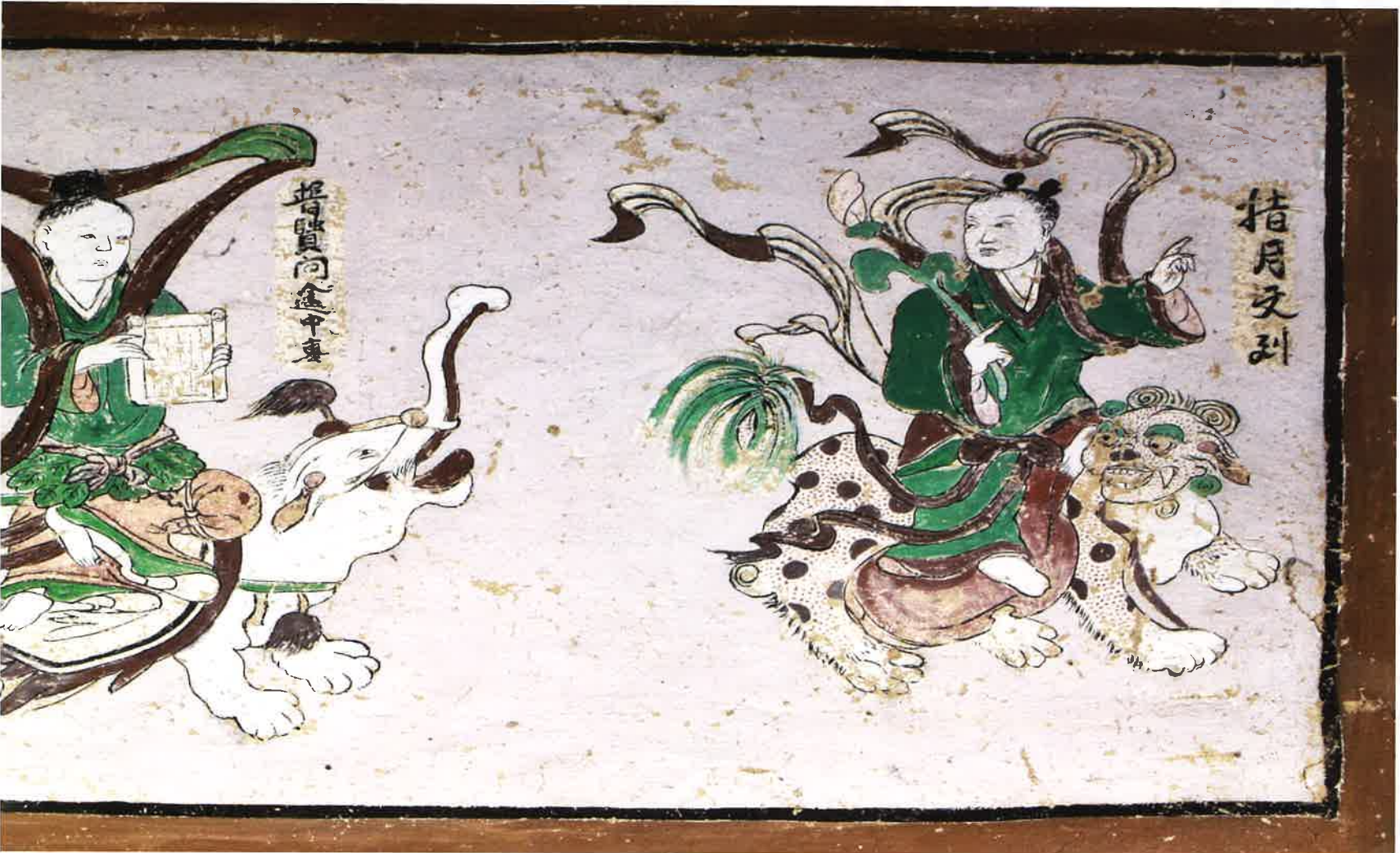
원통전 앞면 별화 1 / 圓通殿 前面 別畫 1 / attached painting 1 on front wall, Wŏn'ongjŏn hall