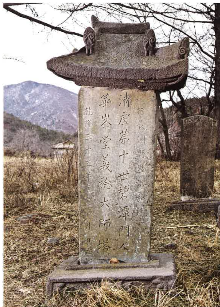
학림사 화봉당대사비 / 鶴林寺 華峯堂大師碑 memorial monument of great priest Hwabongdang, Hangeumsa