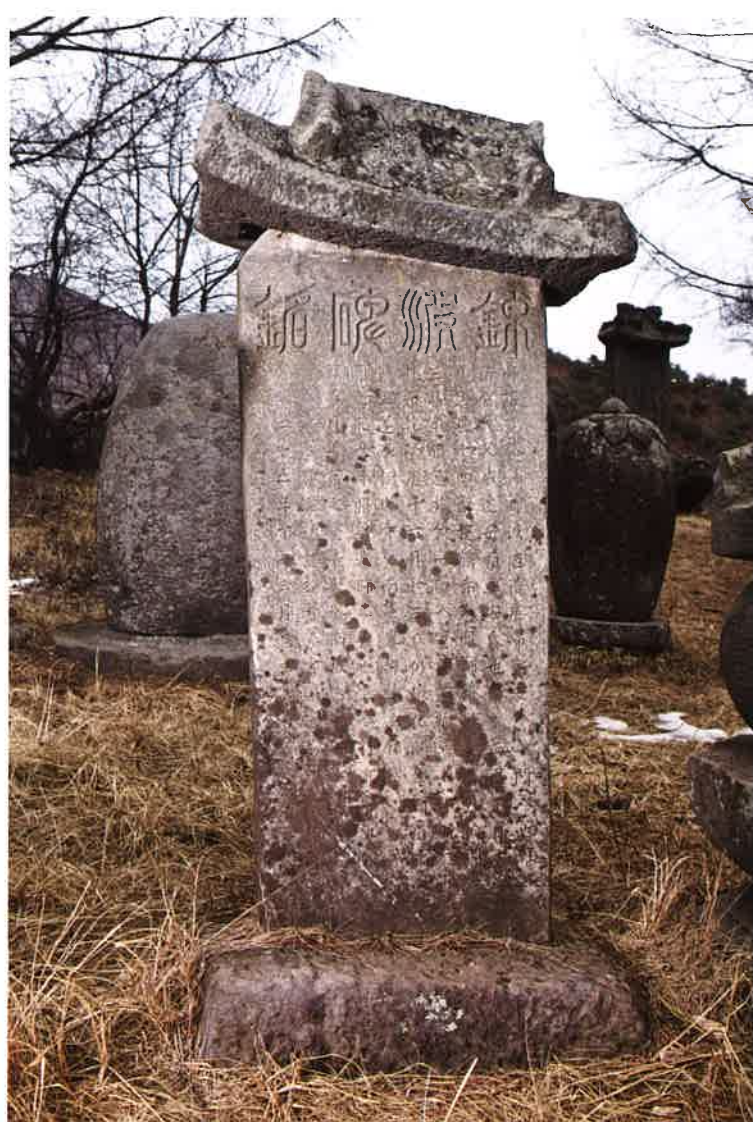
학림사 금파당부도비 / 鶴林寺 錦波堂浮屠碑 memorial stupa monument of Kūmp'adang, Hangeumsa