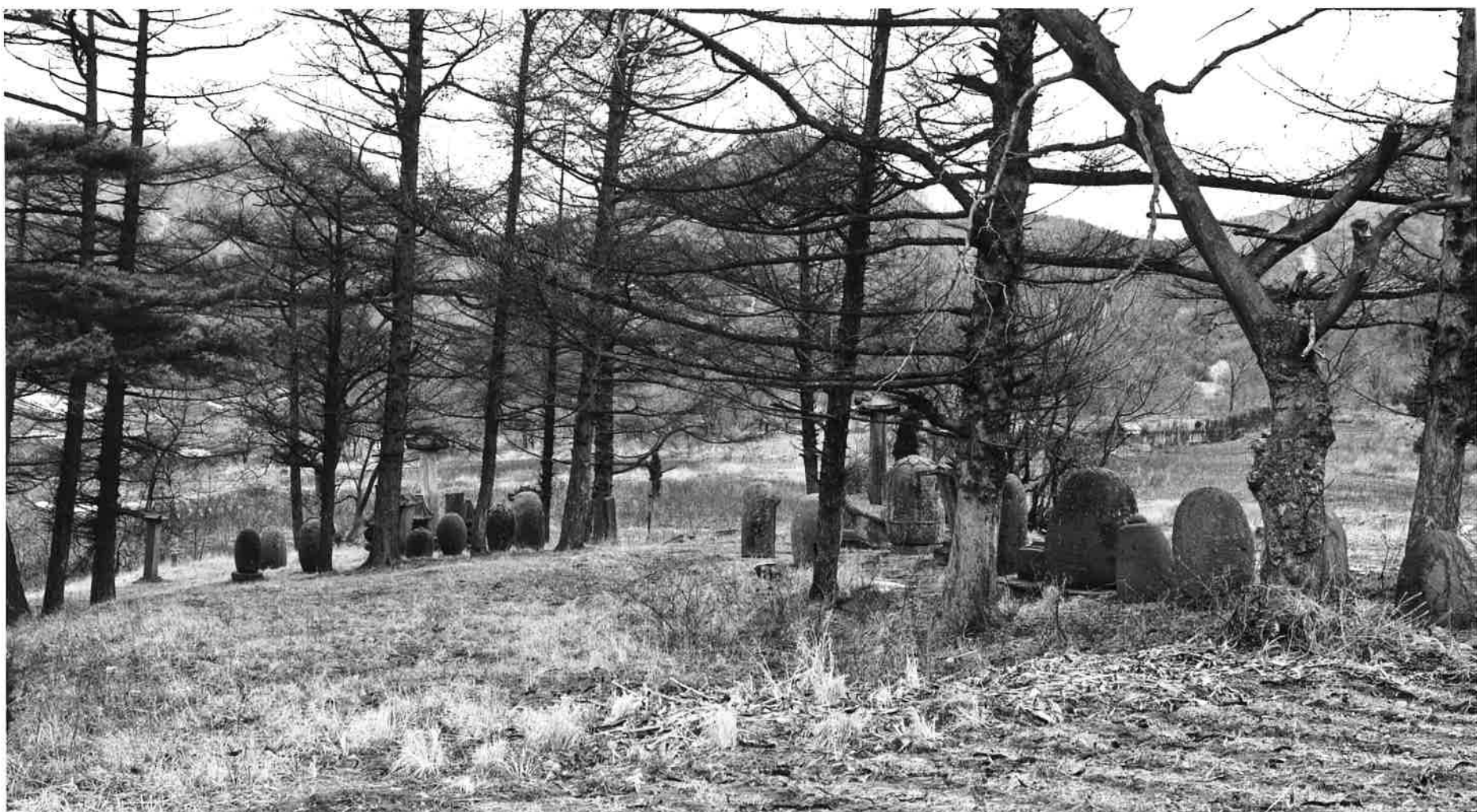
학림사 부도군 / 鶴林寺 浮屠群 / group of memorial stupa, Hangnimsa

학림사 5층석탑은 연꽃대좌형 기단 위에 5층의 탑신과 상륜부를 올린 6.62m의 고려 시기 석탑이다. 2층 기단 위에 5층 탑신부와 상륜을 장식한 일반형 석탑으로, 하층 기단 면석은 각 면에 안상(眼象)이 2구씩 조각되고 네 모서리에 우주(隅柱: 귀기둥)가 모각되었다. 하층기단 갑석의 복련(覆蓮: 아래로 향한 연꽃)은 마모된 상태이다. 상층기단 면석에는 큼직한 안상 1구가 새겨져 있고 상층기단 갑석에는 양련(仰蓮: 위로 향한 연꽃)이 조각되어 있다. 국보유적 제85호로 지정되어 있다.