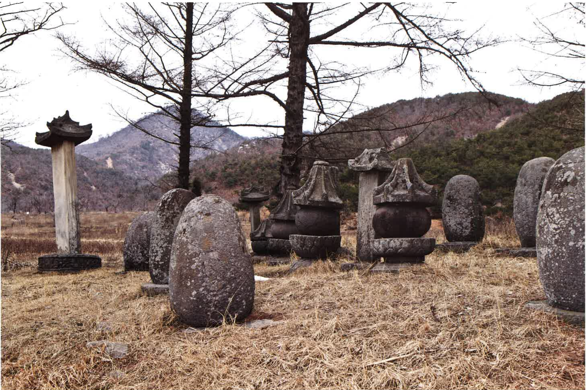
학림사 부도군 부분 / 鶴林寺 浮屠群 部分 / part of group of memorial stupa, Hangnimsa