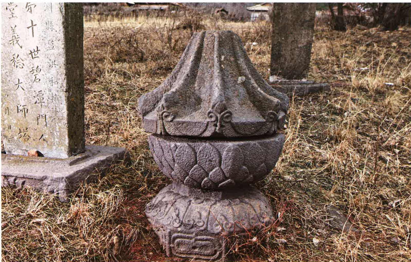
학림사 일명부도 / 鶴林寺 逸名浮屠 / memorial stupa monument, Hangnimsa