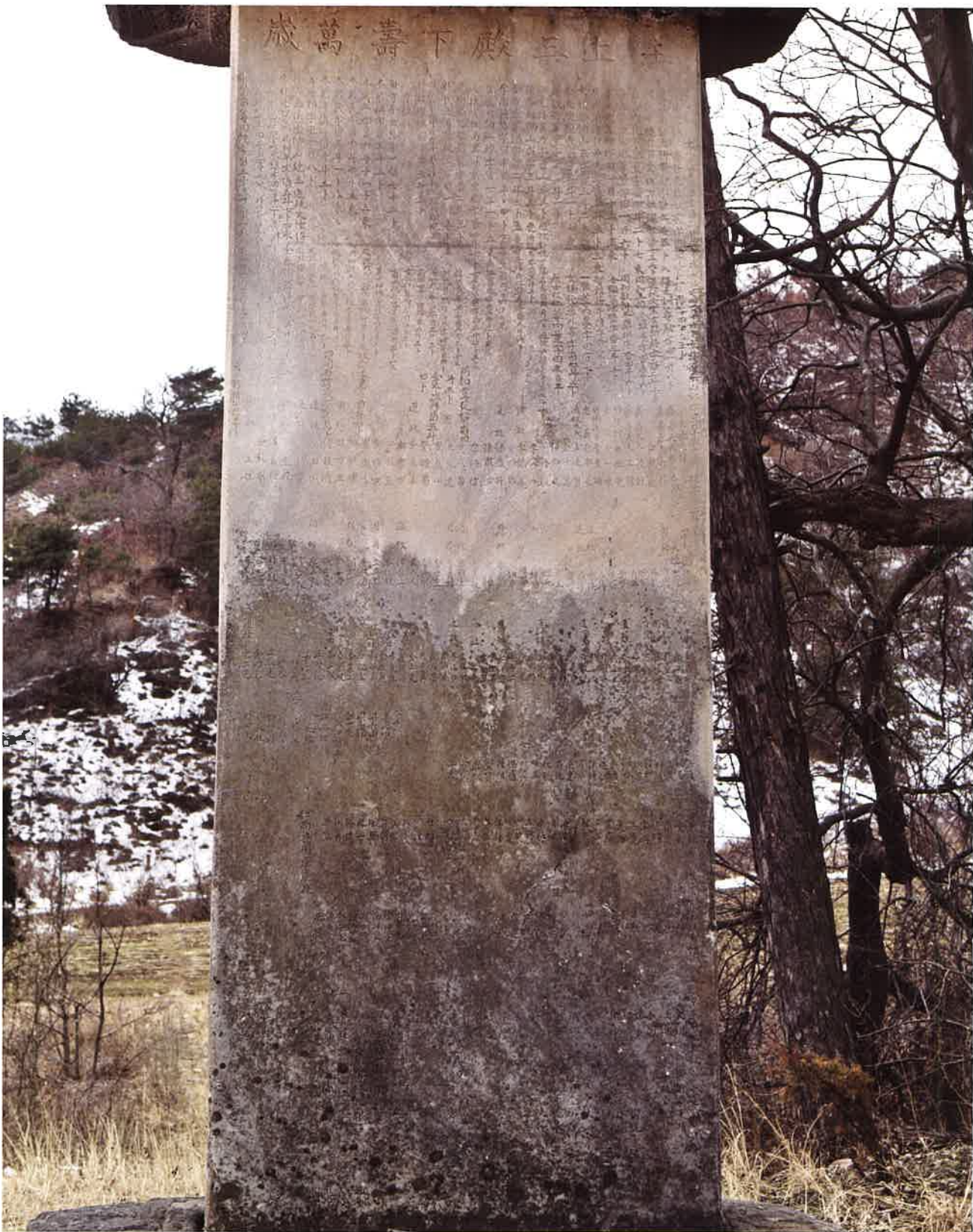
학림사 사적비 뒷면 / 鶴林寺 事蹟碑 後面 / backward side of Hangnimsa historical monument