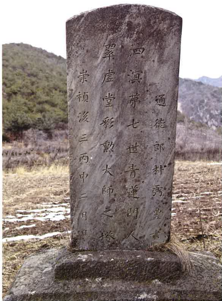
학림사 취허당부도비 / 鶴林寺 翠虛堂浮屠碑 memorial stupa monument of Ch'uihōdang, Hangeumsa