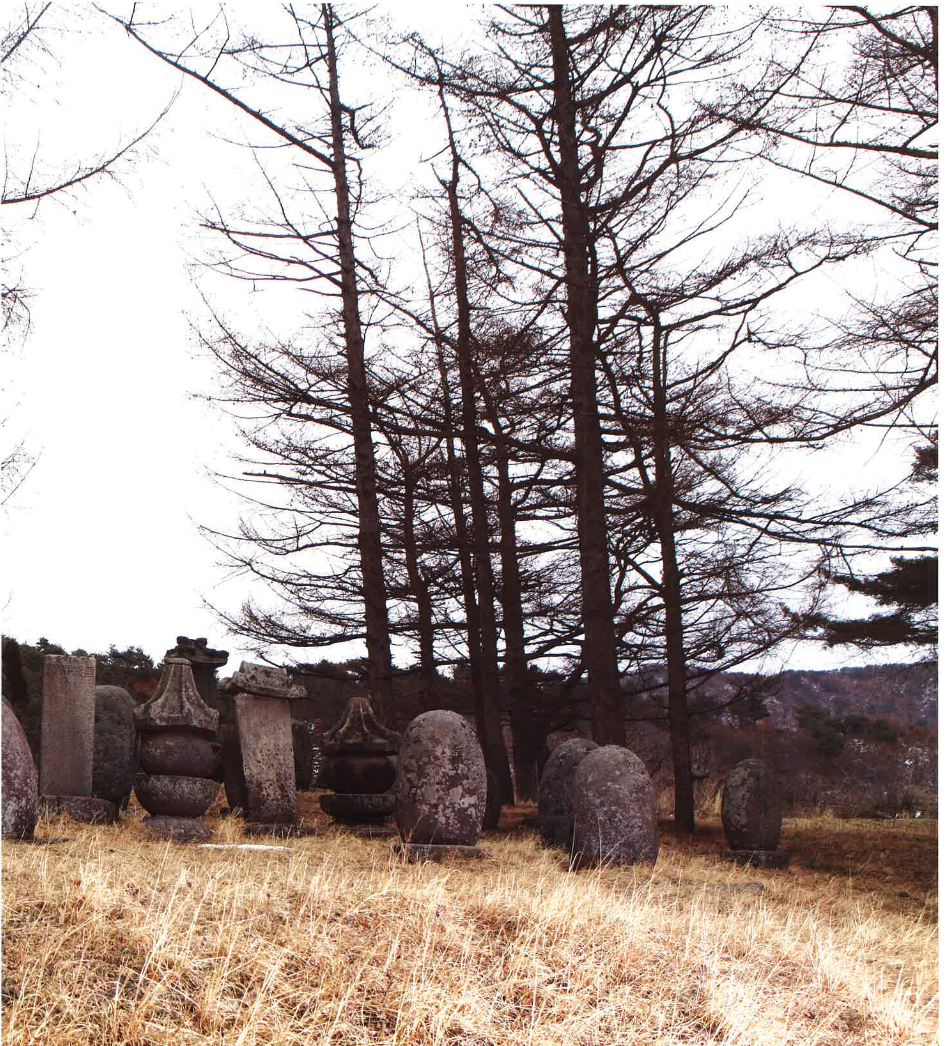
학림사 부도군과 사적비 / 鶴林寺 浮屠群・事蹟碑 / group of memorial stupa and historical monument, Hangnimsa