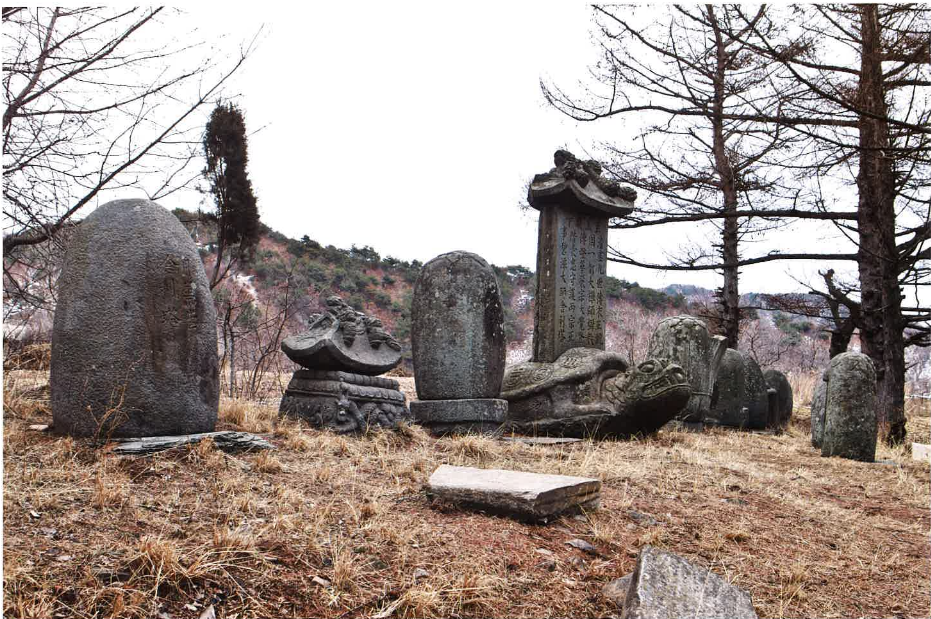
학림사 벽담대사사리탑비와 부도군 / 鶴林寺 碧潭大師舍利塔碑·浮屠群 relics stupa monument of great Pyöktam priest and the group of memorial stupa, Hangnimsa