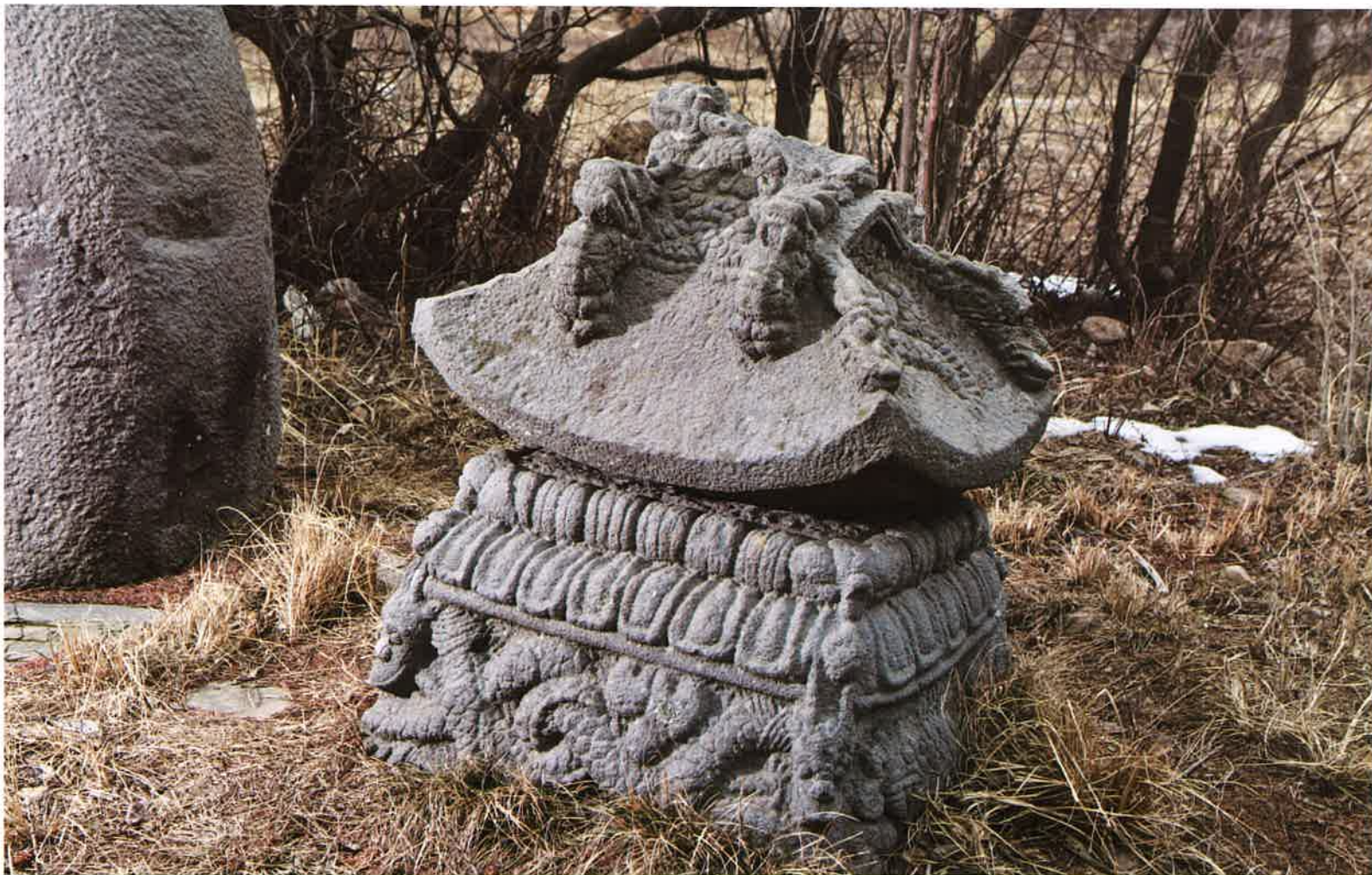
학림사 일명부도비 비좌와 보개 / 鶴林寺 逸名浮屠碑 碑座·寶蓋 / supporting stone and the head of memorial stupa monument, Hangnimsa