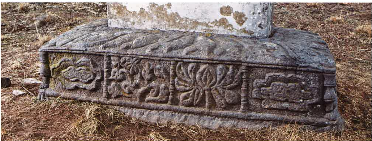
학림사 사적비 기단 / 鶴林寺 事蹟碑 基壇 / stylobate of Hangnimsa historical monument